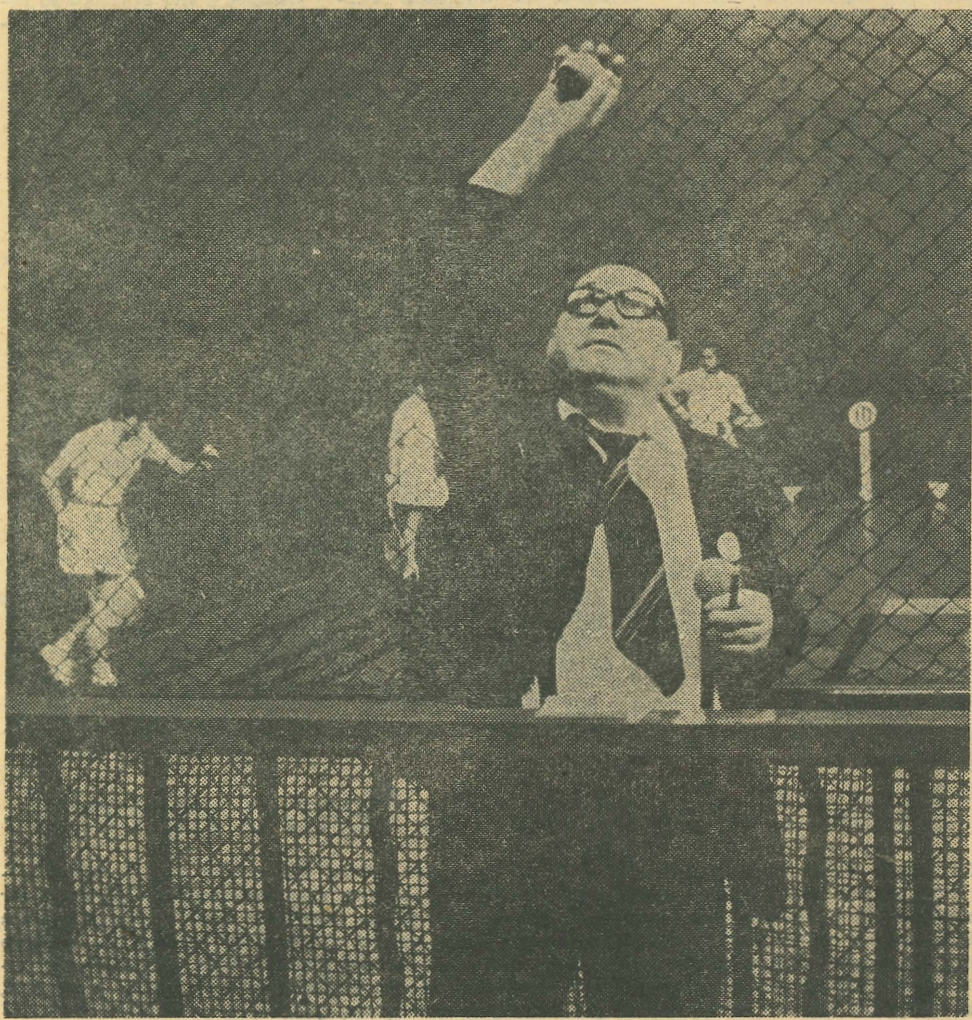
Vocear las apuestas: Las féminas se quejan de que no todo es tan claro como debería, Rejo

Al final de la entrega de premios se concedió la medalla del Círculo de Escritores Cinematográficos a Luis Cuadrado, que se encontraba presente y recibió con gran emoción el emotivo recuerdo.