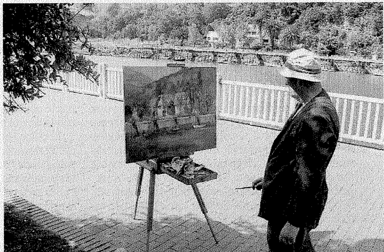
El concurso de pintura cumple su 45 edición. ANDER SALEGI

El concurso repartirá, nuevamente, 2.600 euros en premios entre los