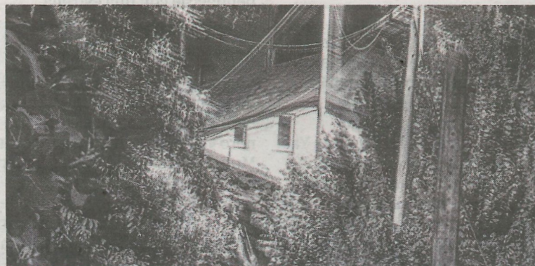
Esta casa de Miraflores, obtenida a la noche, se expone también.