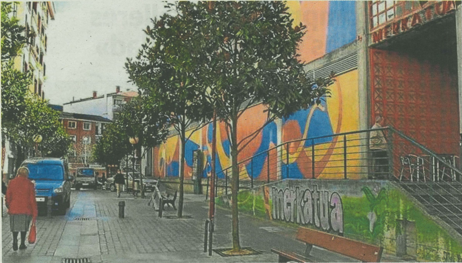
Esta semana se decidirá, en mesa de contratación, qué empresa se encargará de elaborar el proyecto rehabilitación. A. L.