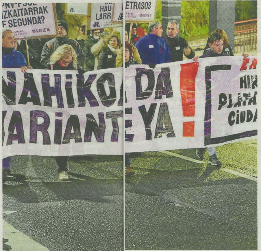
Las manifestaciones se han venido

Por ello, desde el Ayuntamiento de Ermua se reclamará a la Diputación Foral de Bizkaia que concrete cuan-