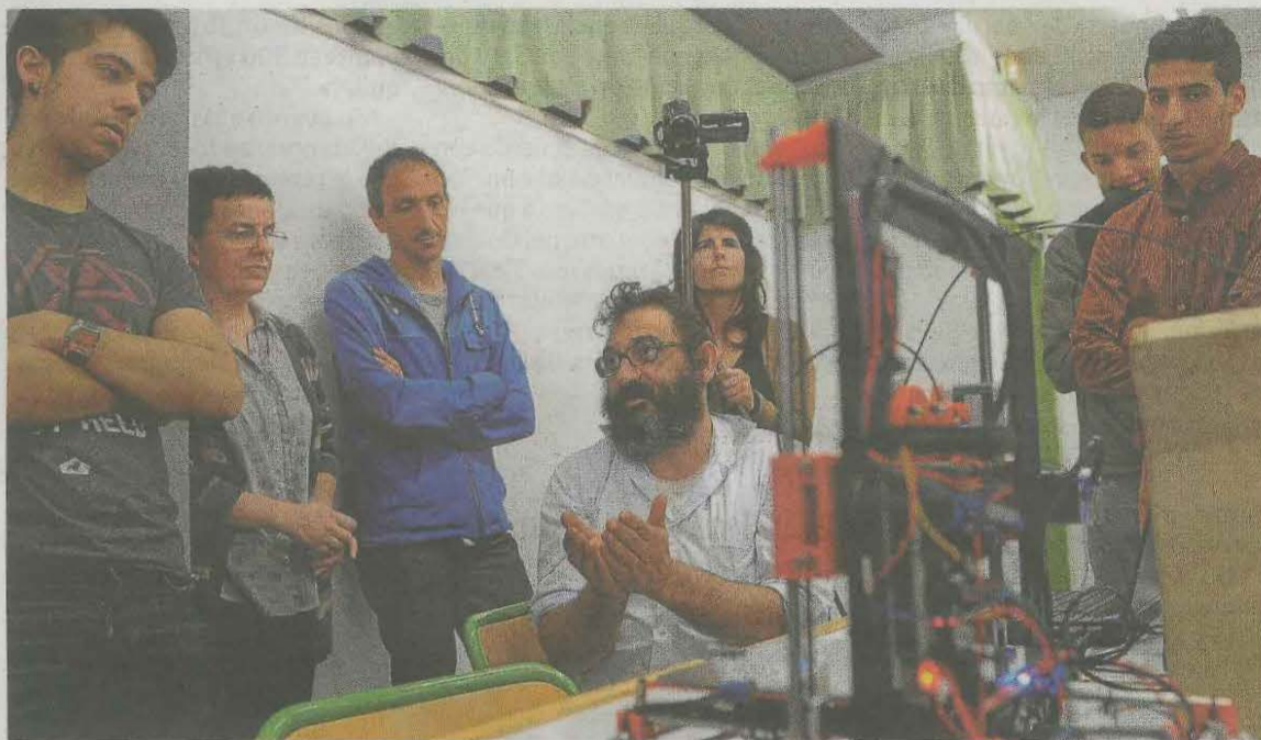
El Uni Encounter vuelve con muchas novedades para los amantes de los ordenadores.

Entre los objetivos de esta iniciativa está que todas las personas aficionadas y atraídas por este mundo