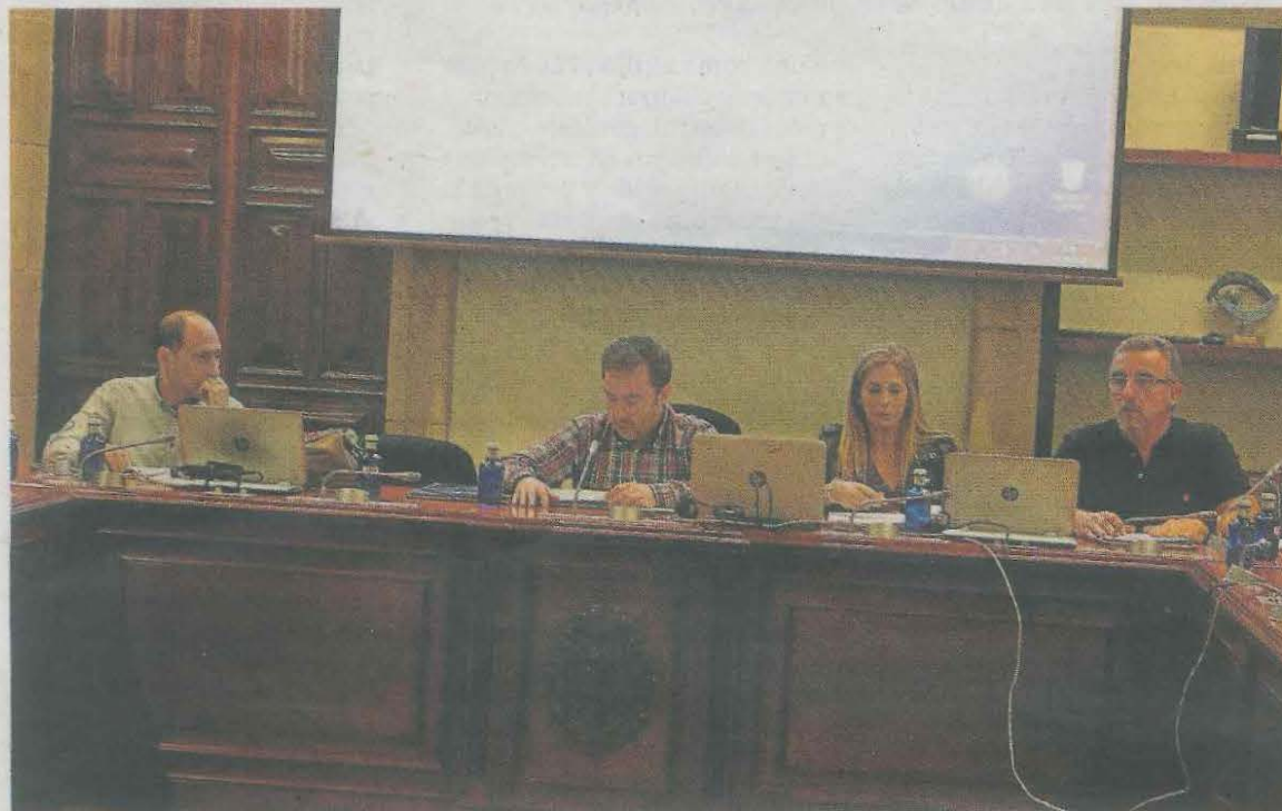
Concejales del PSE de Ermua, en una comisión informativa. A. LASUEN

La exposición abrió sus puertas el lunes y estará abierta los días laborables, de 18.00 a 20.00 horas, hasta el domingo 17 de febrero. La entrada es gratuita.