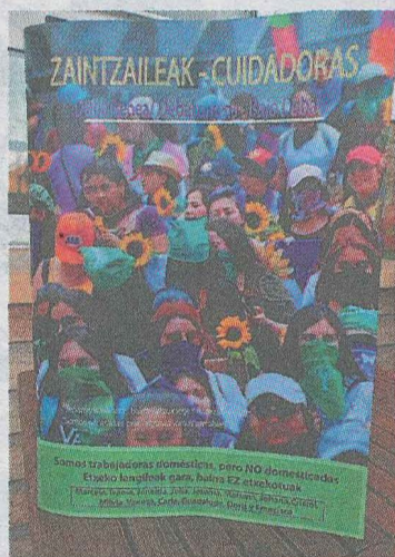
Portada de la revista. A.S.

Al lector o lectora, seguro habrá palabras que gusten y otras que no. En este trabajo, en ningún caso aparecen los nombres de las personas entrevistadas ni sus empleadores. Para conocer de primera mano, lo que piensan de sus condiciones laborales y de vida, se ha llevado a cabo entrevistas a trece cuidadoras y un cui-