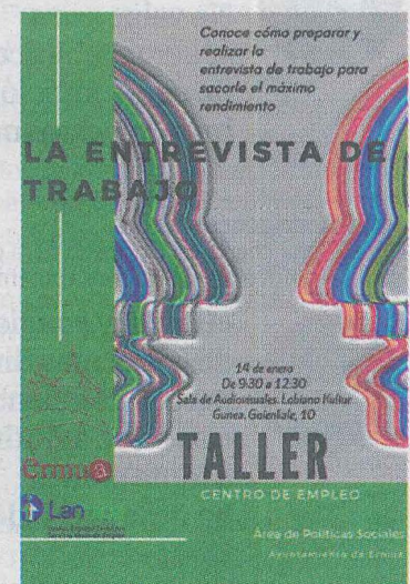
Cartel anunciador del curso.

Si estás interesado en participar en esta sesión, puedes in-