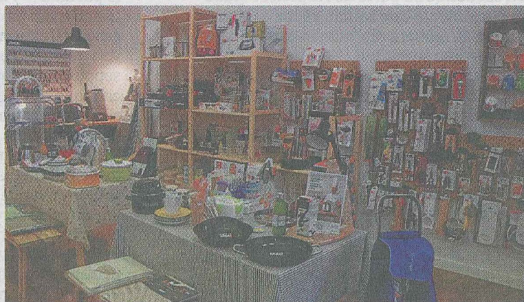
Los comercios pueden optar a las subvenciones. ANDER SALEGI

Tal y como informó el Ayuntamiento el 9 de diciembre, mediante esta ayuda, financiada