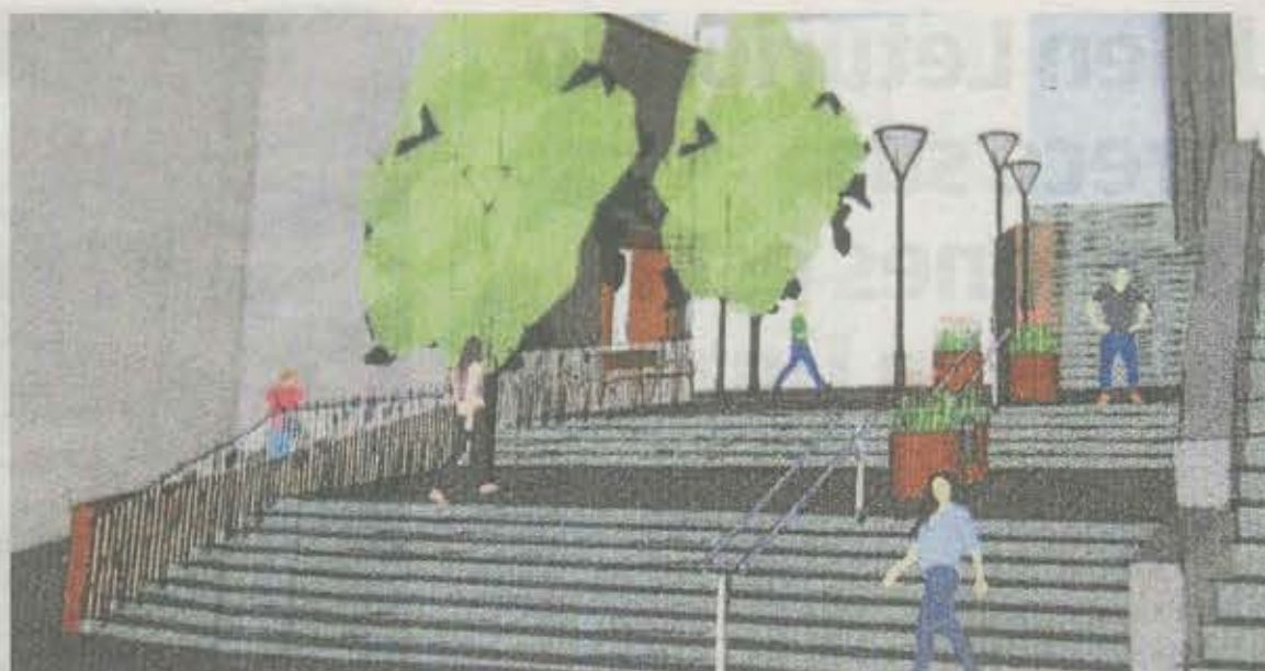
Previsión de cómo quedará la zona de paso tras la urbanización, a falta de la reconstrucción de Aldapakua. A.L.