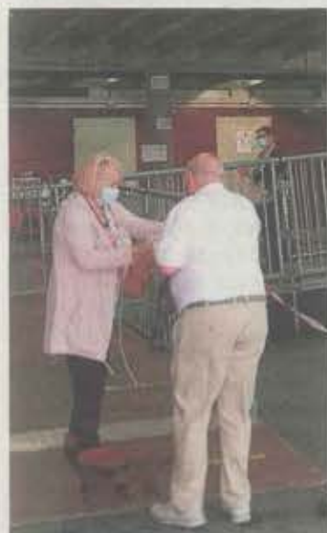
Plaza del mercado. A. L.

La segunda fuerza política con mayor respaldo fue EAJ-PNV con 1.562 votos (un 24,64%). Como tercera fuerza queda EH Bildu con 1.333 apoyos (21,03%), seguida de Elkarrekin Podemos con un total de 749 papeletas (11,82%). En quinta posición quedan PP y C's con 632 votos y un porcentaje del 9,97%. Vox contabilizó con 118 votos, un porcentaje de 1,86%.