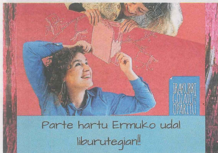
Esta imagen acompañará a la campaña de este año en Ermua.

A esta edición se suman un total de 29 municipios, que además contarán con una lista de libros recomendados por los escritores Aingeru Epaltza y Uxue Alberdi.