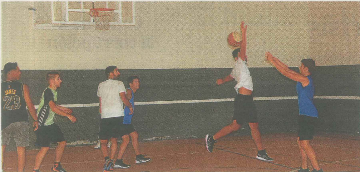
Los jugadores del Zalburdi han entrenado duro para llegar bien al inicio de la competición.