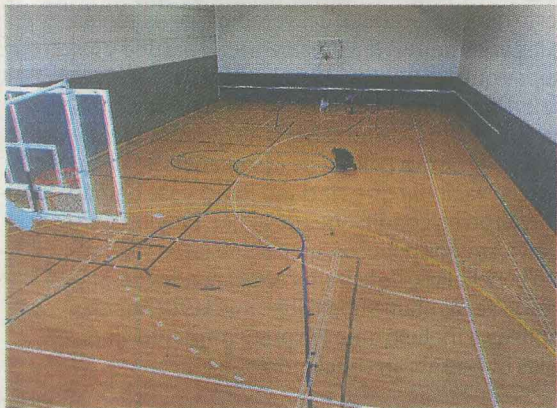
Esta semana se han pintado las líneas de tiro.