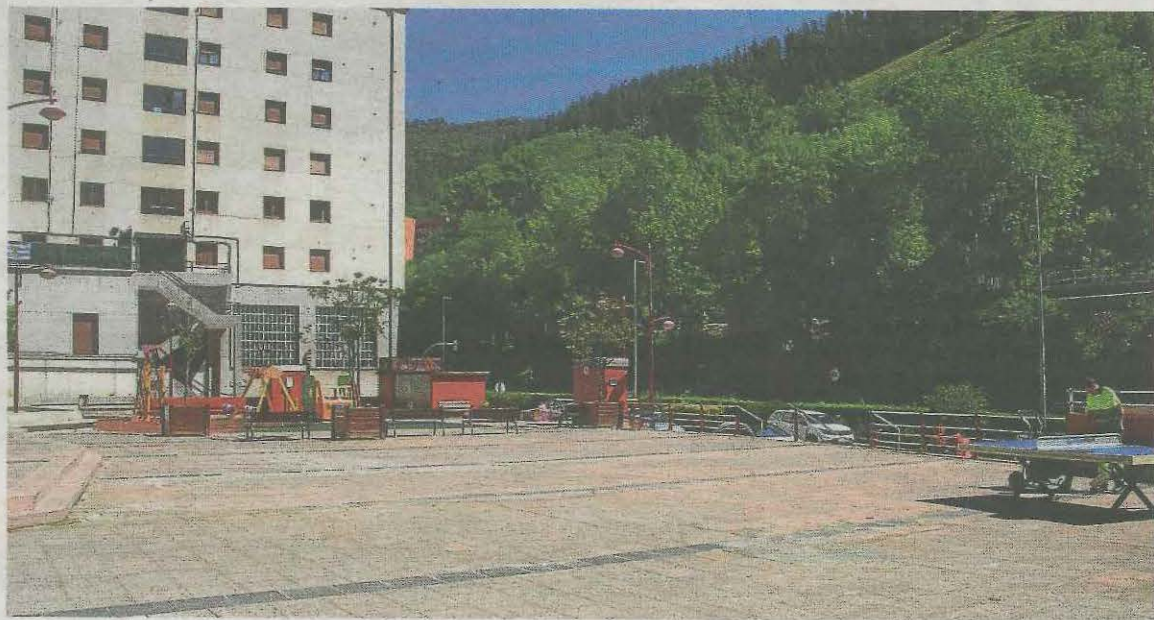
En el parque se instalarán jardineras similares a las que hay en Izelaieta.

de Errotabarri presenta diversos inconvenientes frente a otras zonas, ya que cuenta con menos anchura que otras zonas y la instalación de los nuevos juegos infantiles y la carpa que se instalará en un futuro, gracias a un acuerdo presupuestario entre PSE-EE y EAJ-PNV, hacen que se trate de una zona con mayor afluencia de peatones que en el resto de la avenida. Además, es el paso habitual de la población de la zona para ac-