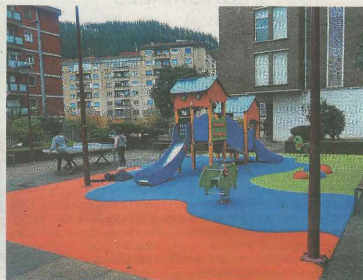
El nuevo parque en la 'plazola de La Forja'.

Por lo que, desde el Ayuntamiento hacen un llamamiento a la ciudadanía, comercios y hosteleros para que separen correctamente los residuos en origen. Para cualquier duda se puede consultar en el departamento de medio Ambiente del Ayuntamiento.