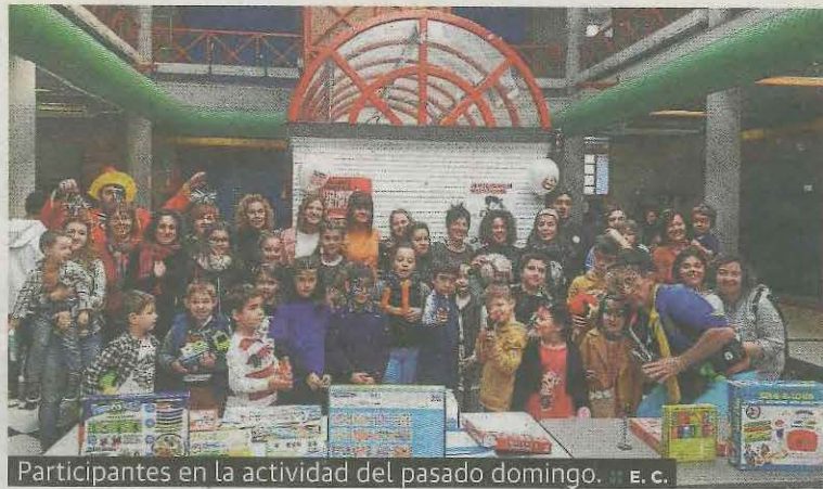
Participantes en la actividad del pasado domingo.

recaudar dinero con este fin. En este punto, numerosa población infantil pudo además disfrutar con el concurso de dibujo, pintacaras y manualidades de adornos navideños, mientras colaboraban con la actividad solidaria. Y la población adulta pudo hacer su aportación con la adquisición de pulseras y playmobil solidarios para contribuir con la investigación de esta enfermedad, de la que se dan 2.600 casos en Euskadi y que aún se ignora su causa.