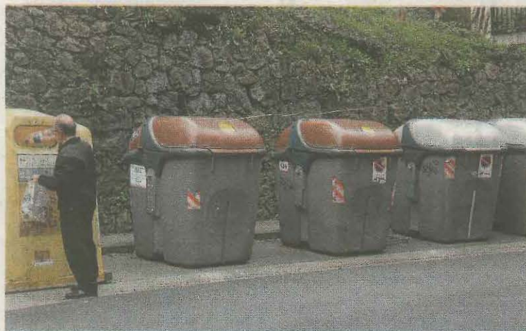
Un punto amarillo identifica los contenedores con 'errores'.

Electricidad Perosanz se enfrentará esta tarde a Errotaundi ISB Iraurgi. El encuentro de baloncesto se disputará en el polideportivo debarra.