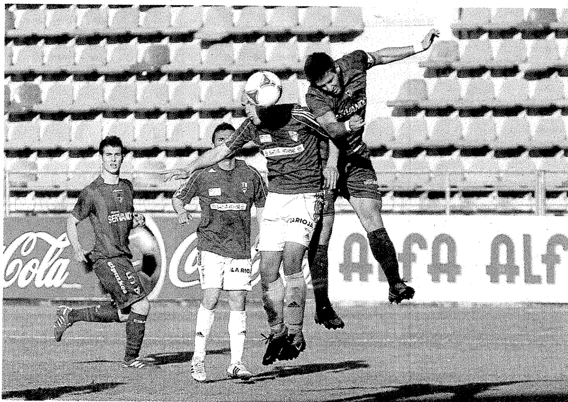
Muchos de los asientos del campo eibarrés se quedan vacíos en los partidos. ■ M. ASKASIBAR

Los seguidores azulgranas parecen necesitar estímulos más fuertes que los excelentes resultados que el equipo de Gaizka Garitano