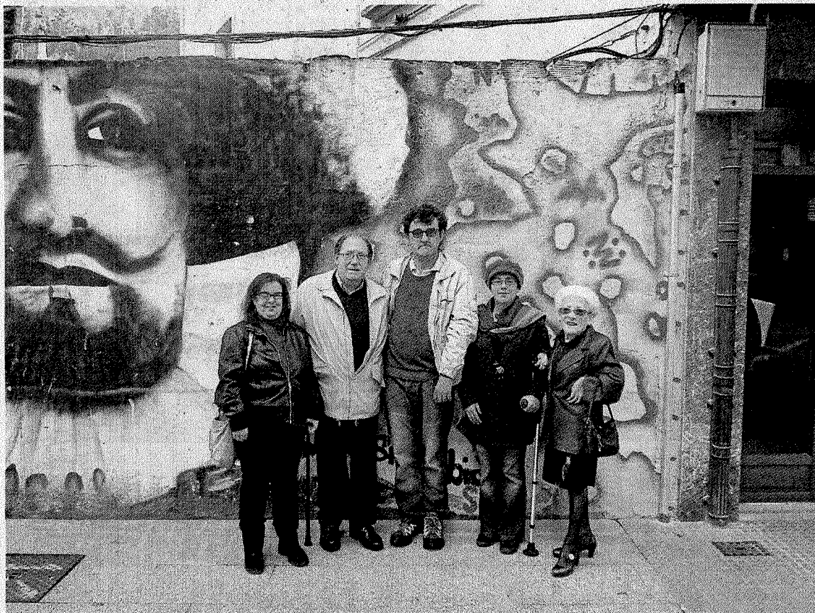
Imagen de los integrantes de la directiva de Bidari, que impulsa la carrera adaptada.

Los horarios aproximados estimados por la organización estable-