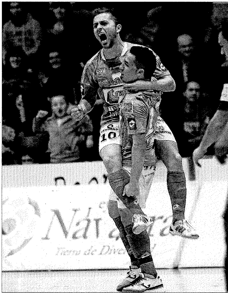
Los jugadores del Triman volverán a luchar por el título.

El Ríos Renovables jugará por primera vez en su historia el play off por el título, pero los blanquiazules lo tienen poco menos que imposible ante el