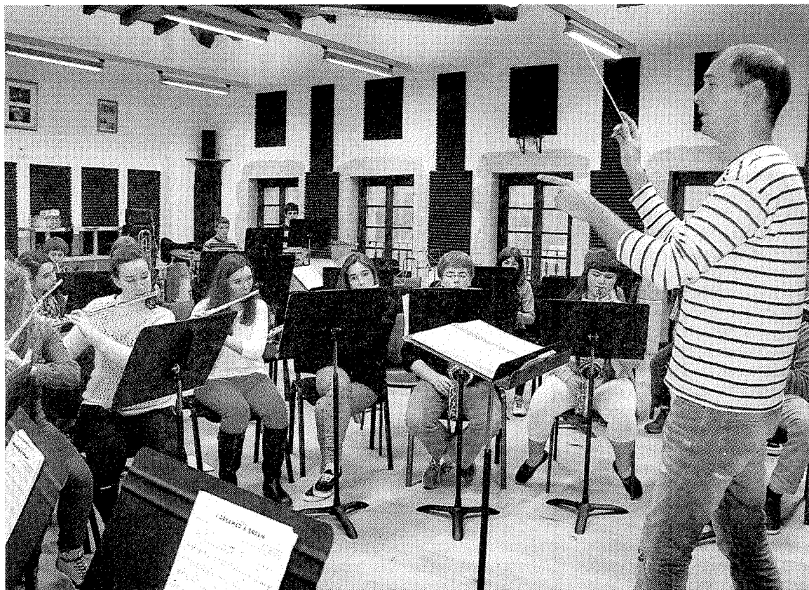
En la Musika Eskola llevan semanas ensayando las marchas para la tamborrada.