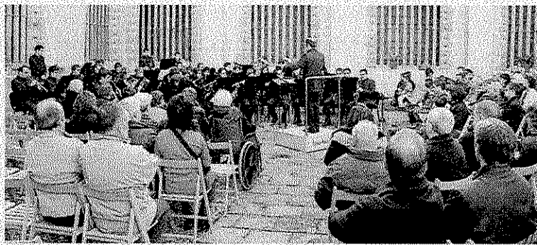
La Banda de Música de Deba actuará esta noche.