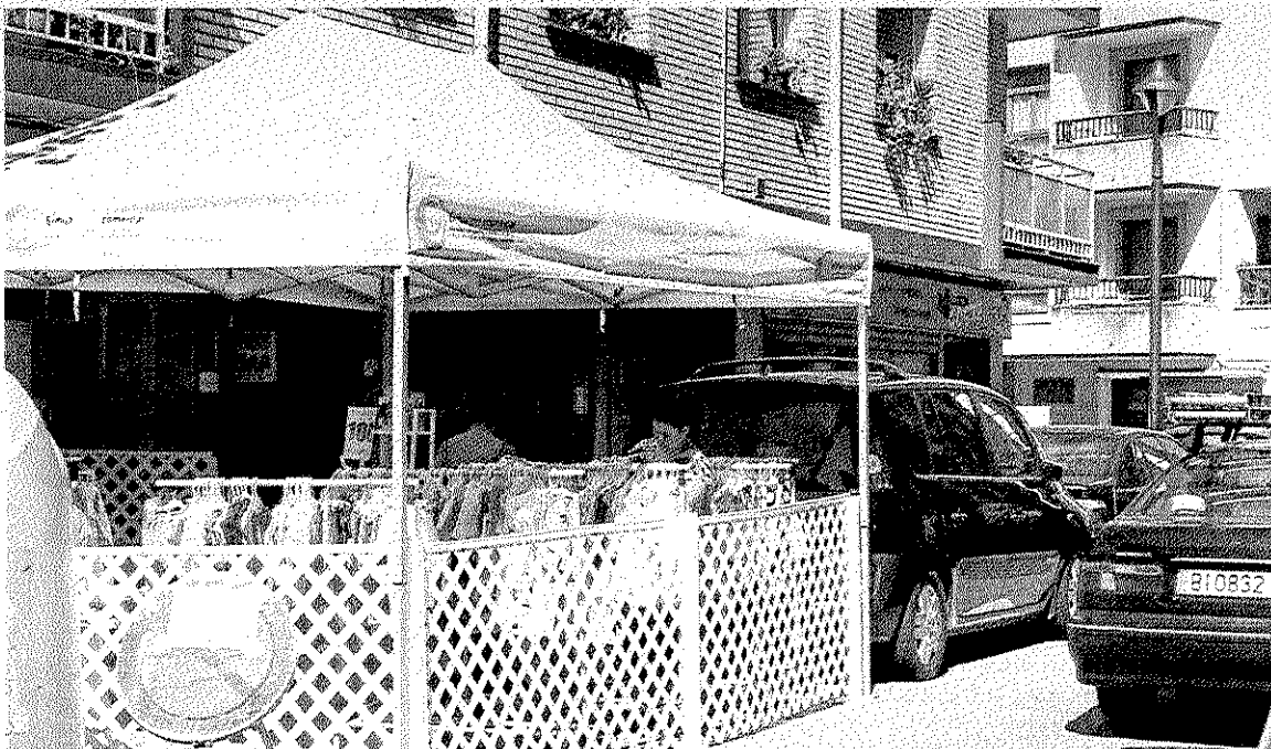
Actividad en una de las tiendas en una edición anterior de la feria de oportunidades.