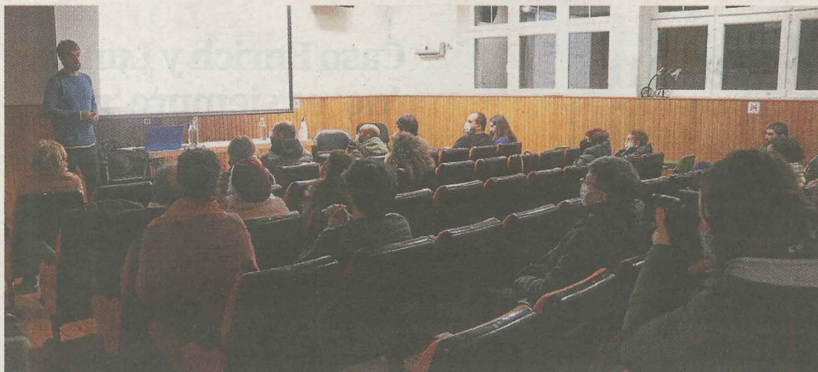
Osasun Haziak taldeak antolatutako hitzaldietako bat. ANDER SALEGI