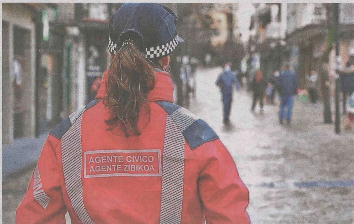
En verano Ermua activó un Plan de Empleo que contrató a personas desempleadas para esta labor. AVTO

El plazo de presentación de solicitudes concluirá el próximo lunes 25 de enero. Para participar en el proceso de selección se podrán presentar las candidaturas por internet a través de la web www.ermua.es/abiapuntu ; de forma presencial en la oficina de Abiapuntu de la calle Konbentukua, de lunes a viernes, de 8.00 a 15.00 horas; o a través del correo ordinario o servicio de mensajería (Ayuntamiento de Ermua,