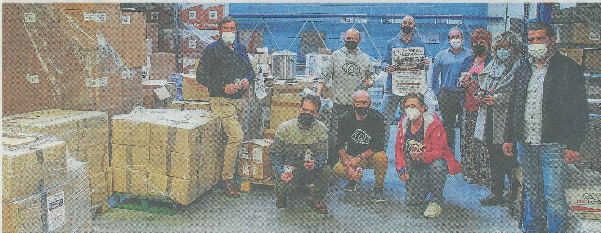
Responsables municipales y entidades de apoyo solidario muestran las cajas con artículos recogidos en la comarca y que serán entregados a Zaporeak y llevados a Lesbos.