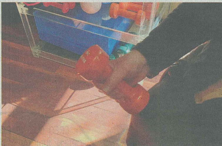
Una persona realiza un ejercicio con una pesa.