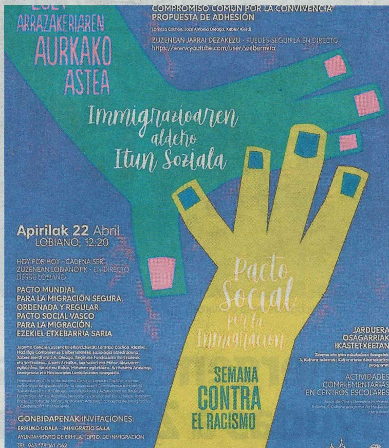
El cartel anuncia las actividades que se llevarán a cabo en Ermua.