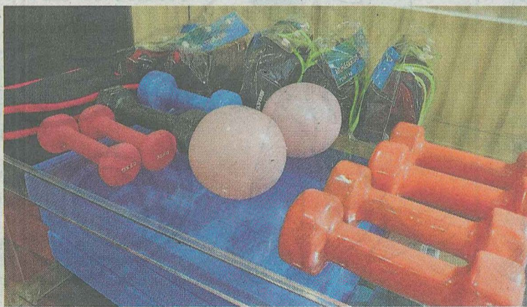
Material de la Mugi-gela.