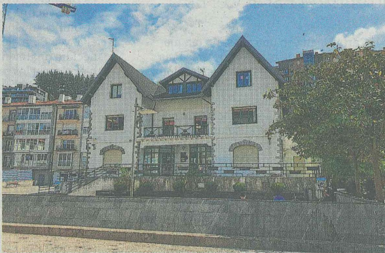
El Hogar del jubilado albergará la Mugi-gela.

Realizan diferentes ejercicios para conseguir estos objetivos: la bicicleta estática o caminar para mejorar la resistencia cardíaca; pesos libres, para aumentar la musculación, ejercicios cotidianos habituales como subir y bajar escaleras para trabajar la capacidad funcional; ejercicios de estiramiento, para ganar flexibili-