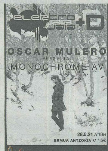
Cartel presentando al dj.

Las entradas tendrán un precio de 15 euros y se pondrán a la venta a partir de las 9:00 horas de la mañana del próximo miér-