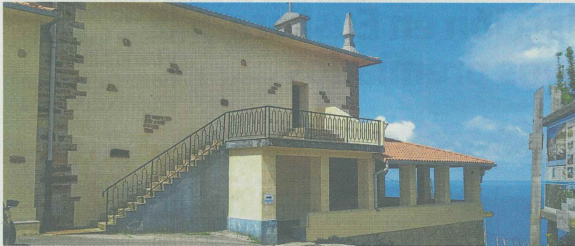
Galbaixko ermitan jokatu da bihar emakume bertsolarien kanporaketa. A. GORRITIBERIA