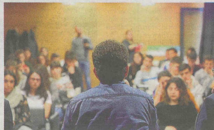
Un momento del café celebrado con los jóvenes de Ermua. :: A. L.

Los responsables europeos confesaron ser culpables de «un fallo de comunicación sobre la UE, ya que no hemos sabido transmitir que la UE además de ser un proyecto económico es un proyecto de valores y apoya el papel de cada estado, un papel que no tendría en el mundo de no ser por estar en la UE» aseguraba Frontán. El alcalde incidió en la necesidad de «trabajar unidos frente a estos retos», además de informar sobre los Fondos Europeos.