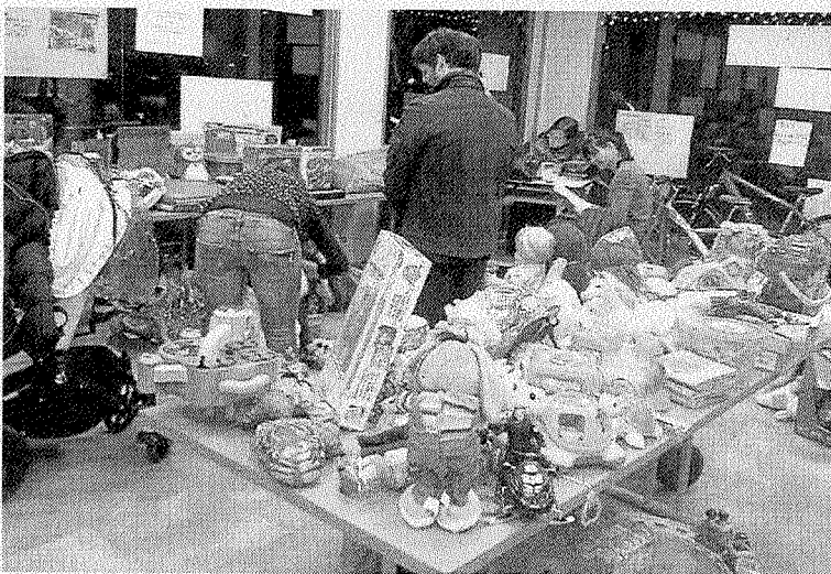
El rastrillo de Mundu bat ha vuelto a ser un éxito este año.

Para que el mercadillo fuera posible, durante un fin de semana los siete miembros de la ONG pidieron a los galdakaotarras los juguetes y otros objetos que pudieran tener una segunda vida. Tras eliminar los más estropeados, sacaron el resto a