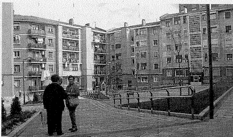
La plaza Autonomía cuenta con nueva red de saneamiento.

En el caso de la pasarela, la redacción del proyecto y dirección de obra supuso un desembolso de 95.000 euros, soportados al 50% por Ayuntamiento y el ente foral.