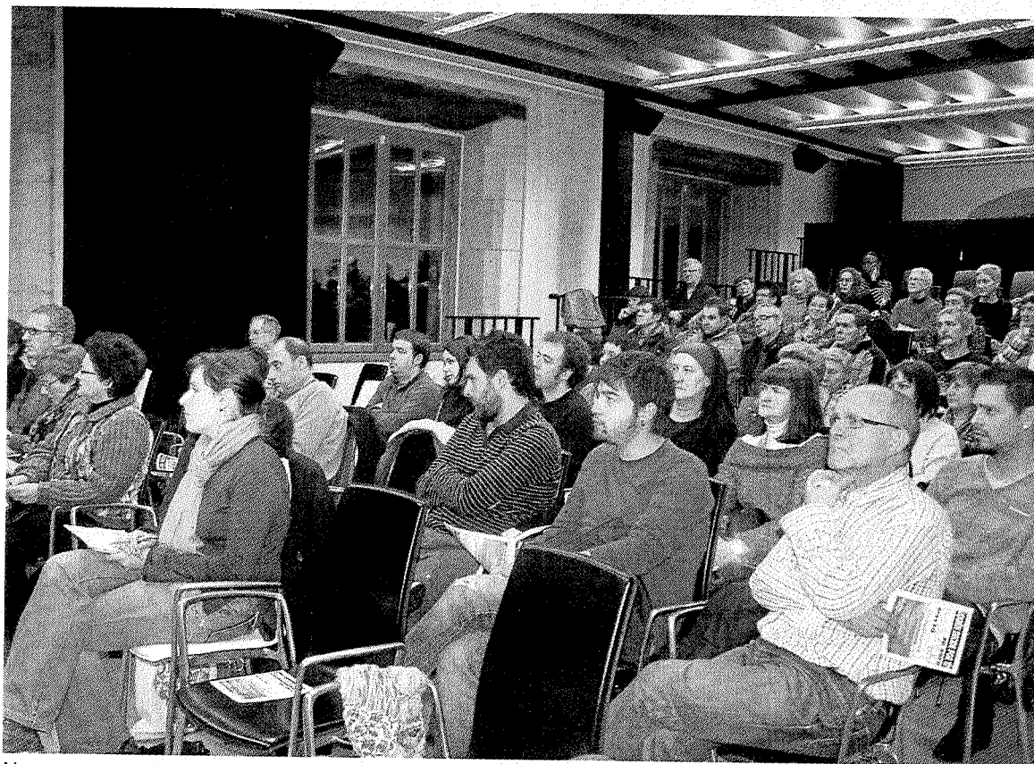
Numerosos vecinos se acercaron a la charla-presentación de 'Stop Desahucios'.

En la citada moción, que presentará 'Stop desahucios', se solicita colaboración municipal con la propias plataformas, que se pongan a disposición de las familias con trámites de desahucio posibles viviendas vacías municipales, que se gestionen alquileres para estas personas y que no se realicen operaciones con las entidades desahuciadas.