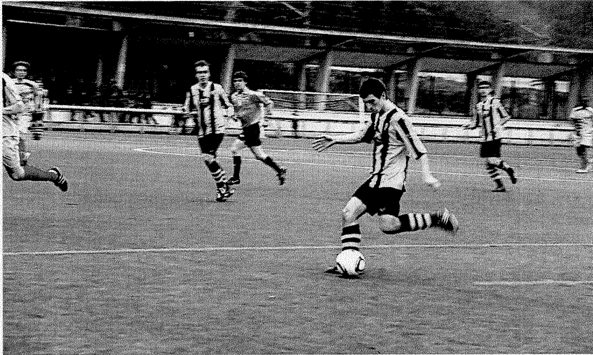
El Amaikak de Preferente consigue la primera victoria de 2013, después de dos empates.