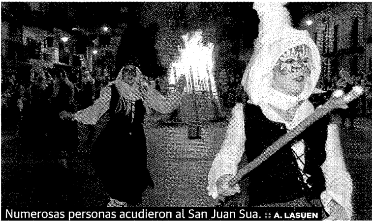
Numerosas personas acudieron al San Juan Sua.