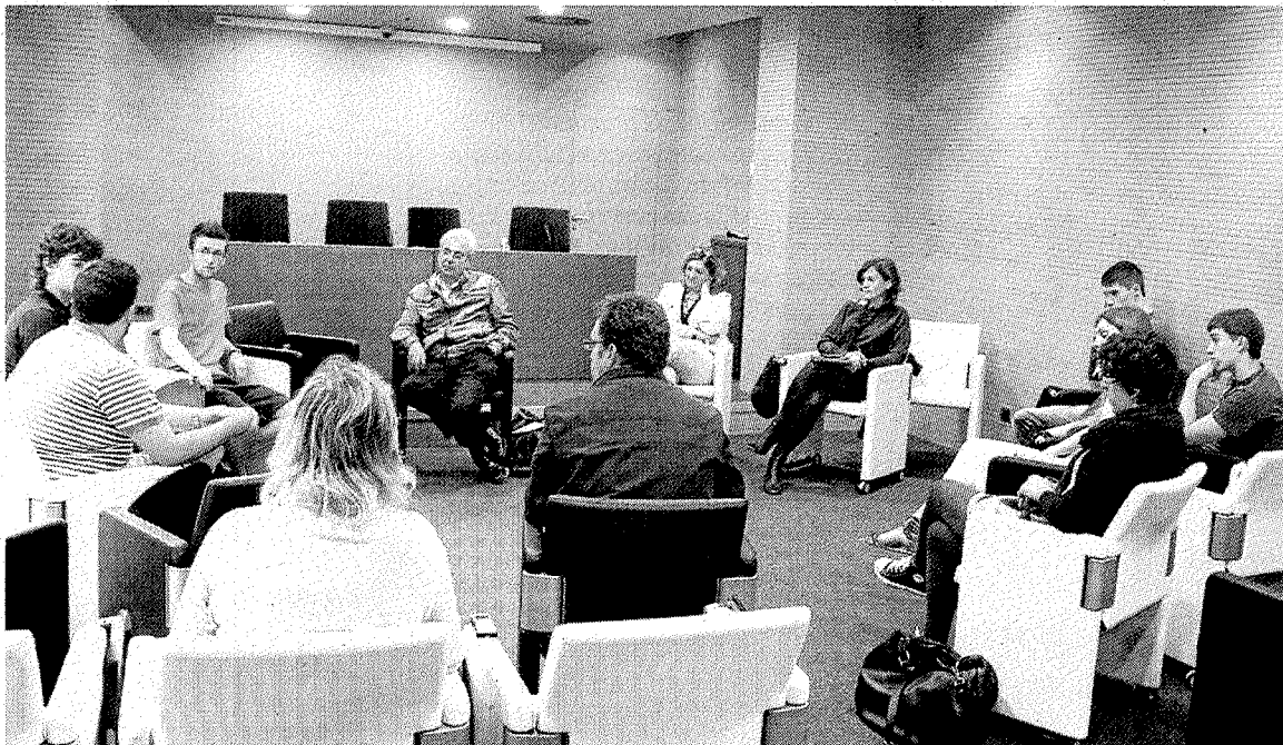
Jóvenes emprendedores ermuarras en una reunión con responsables del Ayuntamiento.

Las charlas se desarrollarán en la primera quincena del mes de julio.