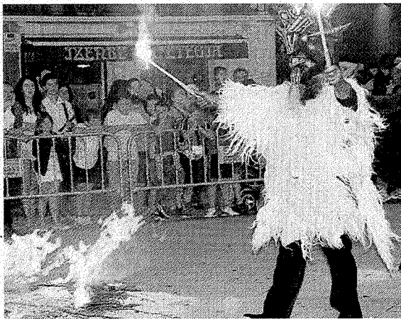
El fuego trajo una noche mágica a Deba.