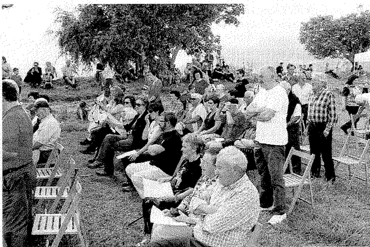
La romería reunió a muchos vecinos.

Los bailes no faltaron esta noche. Y la parte mística llegó con la apari-