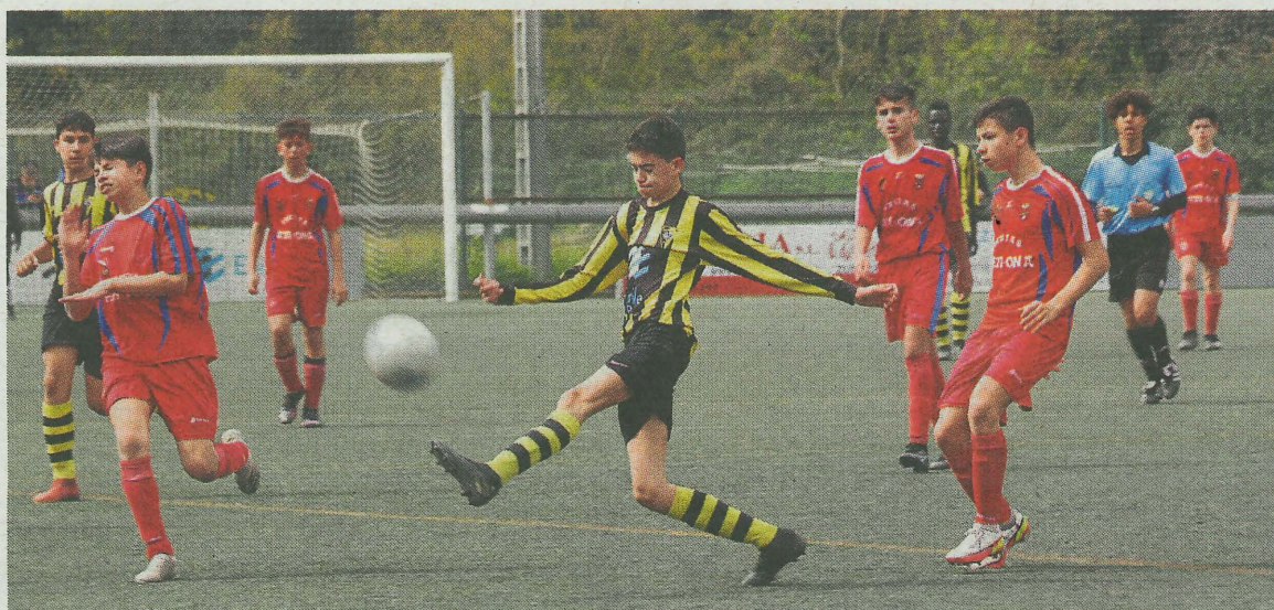
Oxel fue el autor del gol. SALEGI