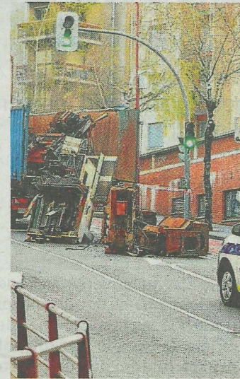
Carga desprendida ayer. AYTO.

Agentes de la Policía Local establecieron el paso alternativo de vehículos y coordinaron las labores de tráfico.