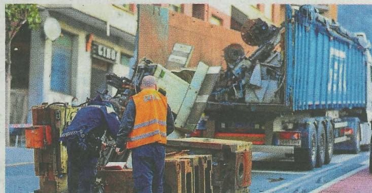
La carga era chatarra pesada y voluminosa. K.I.

El seguro se ha hecho cargo del vehículo articulado y de sus daños, pero no de su carga y de las afecciones que ha producido. Una de las reivindicaciones habituales en el pueblo, son la ejecución de la segunda parte de la variante, que evitaría el paso de camiones pesados por el centro del municipio hacia el Polígono de Goitondo (Hambre).