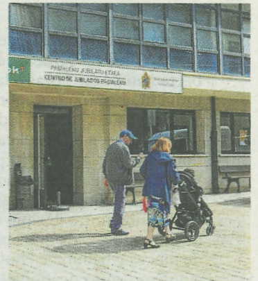
La planta baja está ya abierta.

La Junta Directiva ha acordado reabrir parcialmente y retomar parte de la actividad en el transcurso de una Asamblea extraordinaria concurrida que contó con la presencia de decenas de personas. El centro, en su planta baja, estará abierto todos los