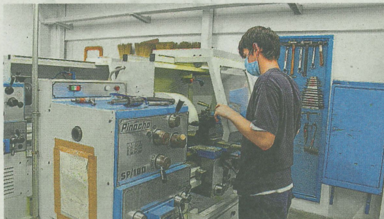
Las clases son fundamentalmente prácticas en las 3 especialidades. A.I.