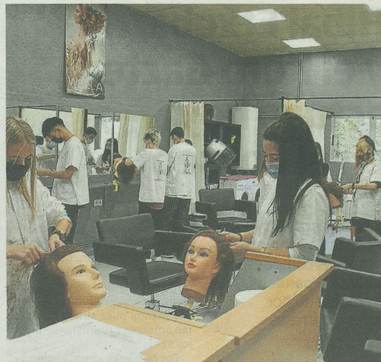
Al concluir el curso deberán elaborar y exponer un proyecto en grupo. A.I.

H uyen de la educación clásica, pero siguen queriendo formarse y en muchos casos lo descubren, directamente, cuando entran a formar parte de la comunidad educativa del Instituto Municipal de Formación Profesional Básica Ermua-Mallabia. Este año son 84 jóvenes de entre 15 y 17 años los que abordarán sus estudios, de 2 cursos en F. P. Básica, en las especialidades de: Fabricación de elementos metálicos, de Mantenimiento de Vehículos y de Peluquería y Estética, en el centro ubicado en Mallabia y gestionado por el ayuntamiento de Ermua.