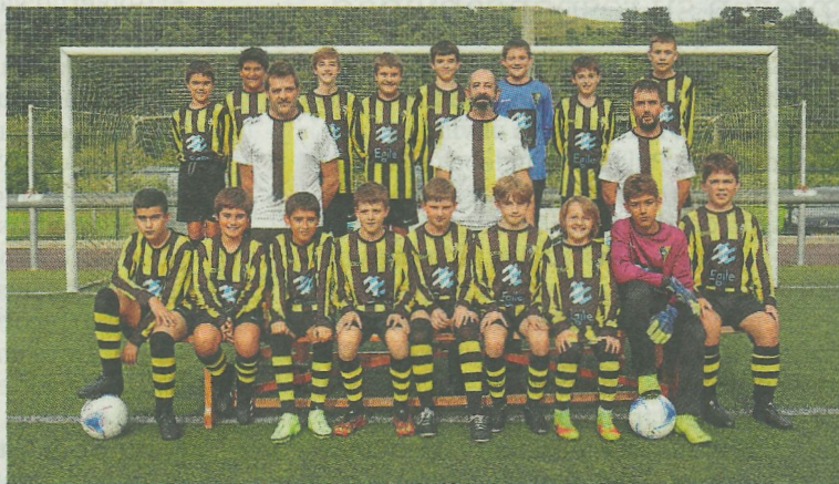
El infantil txiki abrirá la campaña con un derbi. ANDER SALEGI

La falta de puntería de cara a gol le privó de la victoria al Amaikak Bat, en un partido, en Arrasate, en que dispuso de muchas y muy claras ocasiones. El Amaika tuvo que conformarse con un empate que, después de lo ocurrido durante los noventa minutos, sabe a poco. Pronto se vio la ambición de los debarras y las ocasiones de gol comenzaron a llegar una detrás de otra. La primera fue un mano a mano de Duñabeitia con el portero tras un gran pase de Aznal, pero el atacante debarrá estrelló en el poste su disparo. El Amaika mantenía a raya al Mondra, que en ningún momento de la primera mitad se sintió cómodo. Los debarras no cesaron en su intento de jugar en campo contrario y buscar la portería rival, así llegó otra buena ocasión, tras una recuperación de balón, Julen Etxebarria intentó sorprender al portero con un tiro lejano, pero su lanzamiento se topó con el larguero. A punto estuvo de adelantarse en el marcador el Amaika hasta en otras dos acciones a balón parado, pero la falta de puntería en una, y la buena labor del portero del Mondra en otra lo evitaron. La superioridad de los de Errotazar no se vio reflejada en el marcador