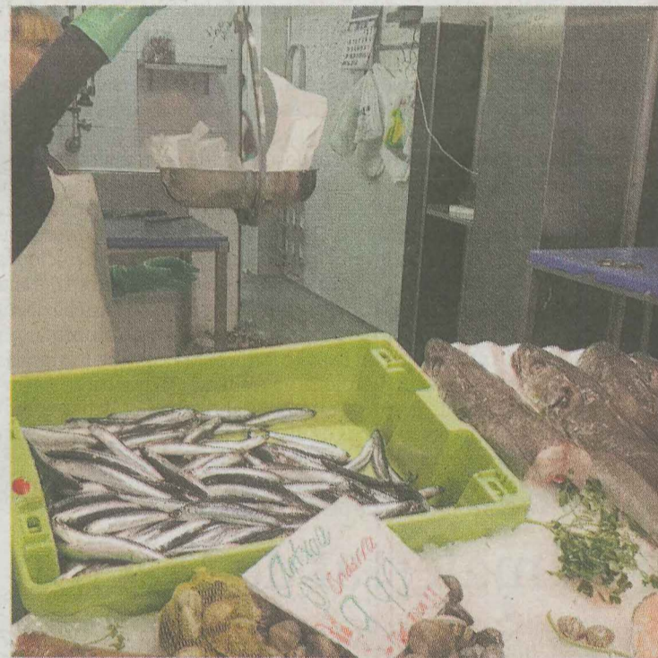
Anchoas en una pescadería de Ondarroa.

tudios científicos, pero el tamaño pequeño está jugando una mala pasada a los arrantzales. La anchoa era 39 a 45 gramos está a unos precios de 1,30 a 1,35 euros kilos. Ahora bien, no es la de tamaño más deseado. La grande es difícil de encontrar. La pequeña satura el caladero. Sin embargo, en Asturias se ha descargado anchoa de 29 piezas el kilo, a unos precios de 7 euros-kilo, lo que ha permitido rentabilizar las faenas.