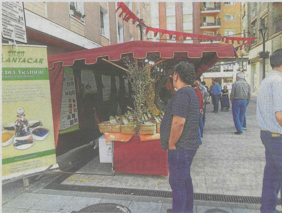
La plaza se llenará de actividades y puestos medievales durante todo el fin de semana. A. LASUEN

Hoy, tras la apertura de la feria, a las 17.30 horas se abrirá el rincón infantil. A las 18.00 horas se realizará el pasacalles inaugural. A las 19.00 horas habrá animación musical y a