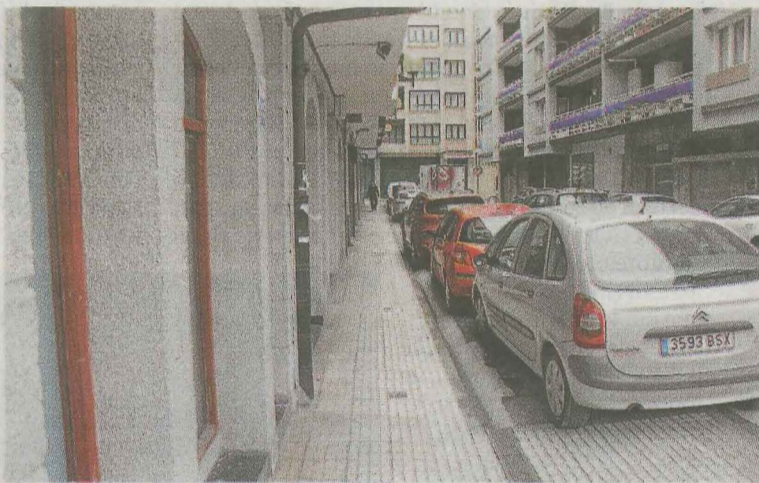
Trabajos en marcha en la N-634, y la calle Angulero.

los aparcamientos en el lado que se encuentren en obras.