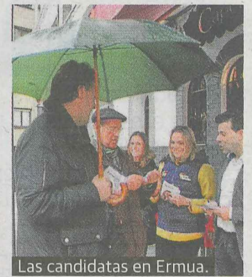
Las candidatas en Ermua.

El candidato popular ermua-rra se refirió al PP como la solución frente a «que Bizkaia, Ermua y España se estén apagando. Sólo hay que ver el cierre de negocios, autónomos que pierden sus trabajos, mientras los socialistas se empeñan en continuar con sus promesas sin sentido».