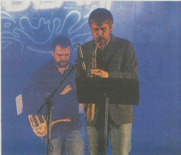
Un concierto de Jazzez Blai.

Pues bien, ahora el festival Jazzez Blai vuelve con una innovadora pro-