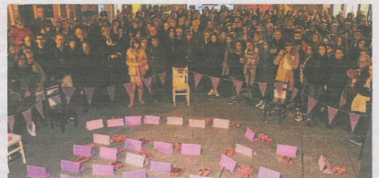
Un momento de la concentración del lunes en Ermua.

De hecho, estas asociaciones repartieron el comunicado completo consensuado con mujeres y asociaciones del Consejo de Igualdad, con párrafos subrayados que, según el escrito, «han sido censurados por la concejala de Igualdad». Estas asociaciones explicaban que «tuvimos que retirar los últimos párrafos del comunicado para que el acto se celebrara como siempre, ya que nos invitaron a hacer otro acto en otro lugar del municipio si queríamos leer esos párrafos y no lo hemos hecho por el bien del objetivo común de este día». Estas asociaciones calificaban como «violencia institucional» las actuaciones vividas en las últimas fechas.