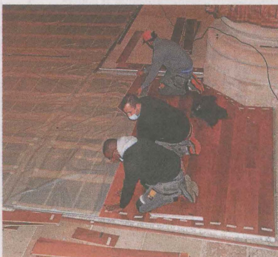
Operarios de Cantabria en plena faena.