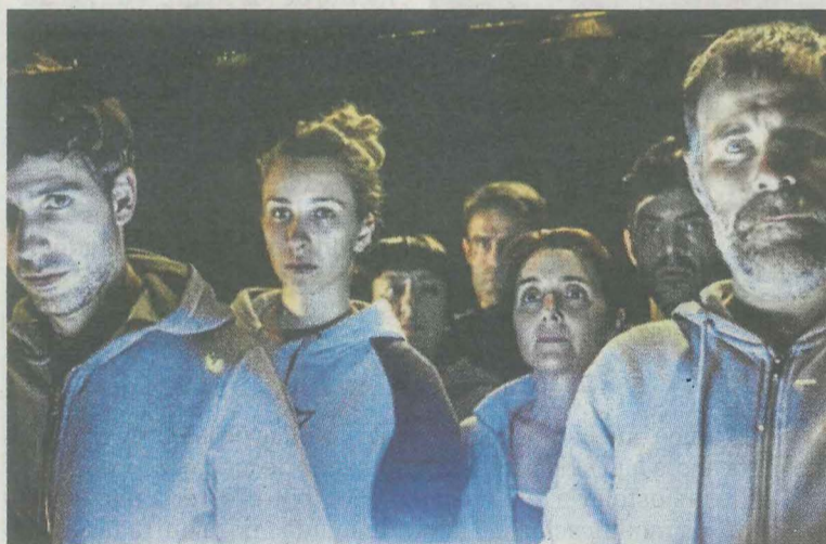
'Zaldi urdina' se representará hoy a partir de las 20.00 horas. E.C.

En esta nueva versión, Gorakada presenta un 'Pinocchio' que es de verdad, pragmático, travieso e inteligente