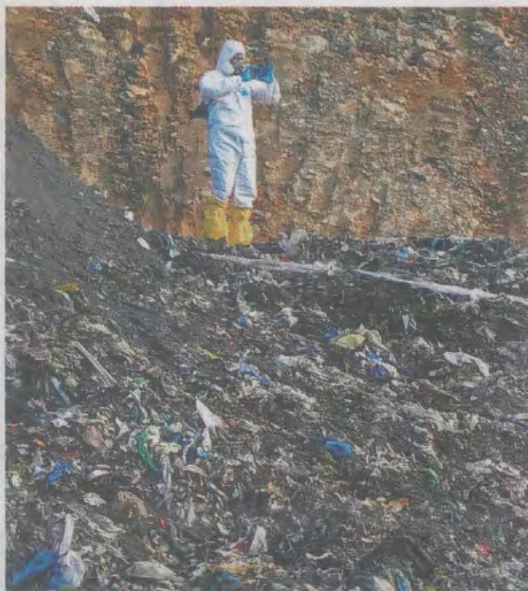
Un ertzaina realiza fotografías en la zona de búsqueda. IGNACIO PÉREZ

Según explicó la compañía a través de un comunicado, el depósito donde ahora se reubican los residuos que se extraen de la zona de búsqueda «está próximo a colmarse y requiere de más espacio para garantizar que se