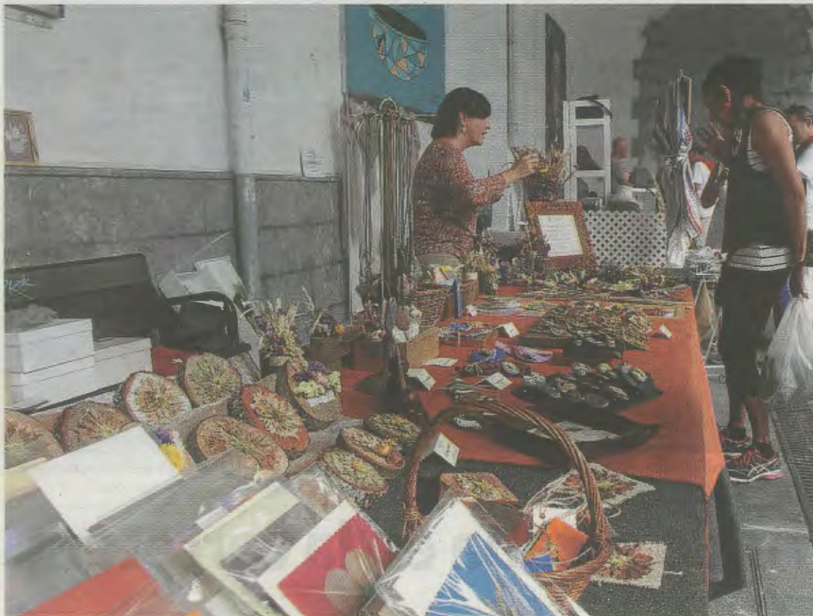
La oferta de la feria será muy variada, como es habitual. SALEGI

De este modo, mañana varios artesanos podrán exponer y vender sus trabajos en Deba, adoptando siempre las medidas sanitarias y de seguridad que exige la situación derivada de la Covid-19.