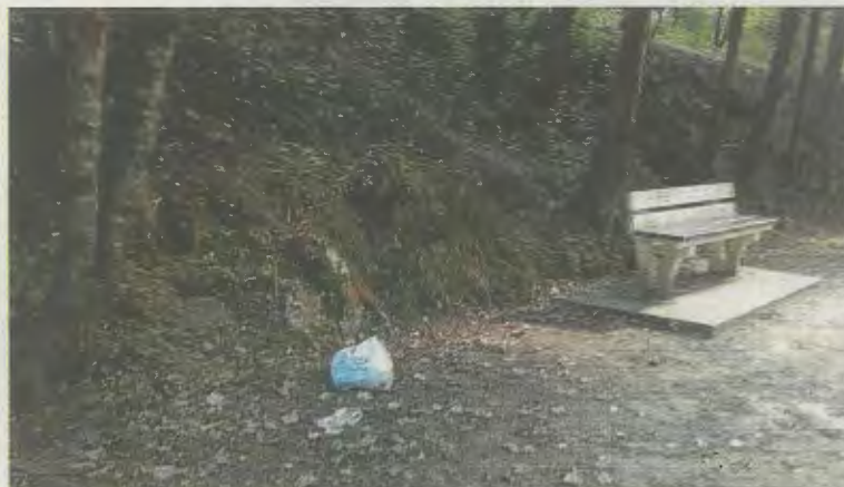
Zakarrontzirik ez eta, zenbaitek zaboarra lurrean uztea erabakitzen du.

Gaur egun, ibilbide guztian ez dago zakarrontzi bat bera ere ez eta uda sasoi honetan, gerizpe asko dagoenez jende asko joaten da bertara. Joaten diren pertsona batzuk, plastikozko poltsak