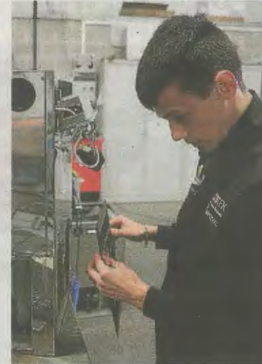
Estudiante de FP.

El programa Kontrata30 supone una inversión extraordinaria en el contexto de la crisis generada por la pandemia del coronavirus, que se suma a los cinco millones de euros del Plan para la Defensa del Empleo. Su objetivo es ayudar a los jóvenes a dar sus primeros pasos en el merca-