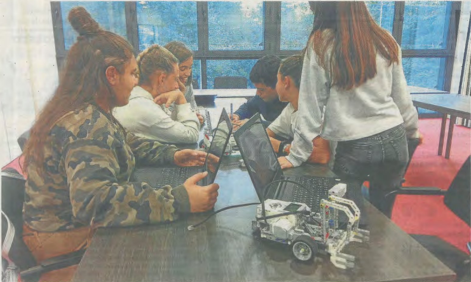
Jóvenes ermueños practican con la robótica en una edición anterior de este divertido programa local, para jugar mientras se aprende. AINHOA LASUEN