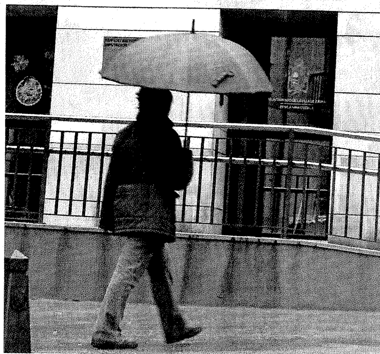
Entrada a las oficinas de Servicios sociales de Ermua.

► Servicios. Asesoría jurídica, apoyo psicológico, intermediación vivienda y banco alimentos.