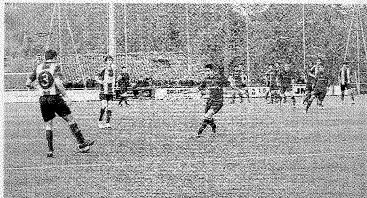
El Aurrera pasó el examen en Mondragón y mantiene la categoría.

Ondarroako Udalak gonbidatu egin nahi zaituzte Eskola Agenda 21eko Udal Forora. Udal Forora maiatzaren 29an goizeko 11:00etan izango da udaletxeko pleno aretoan. Adierazi nahi dizuegu baita ere etortzerik ez baduzue bertako informazioa bidali egingo zaizuela.