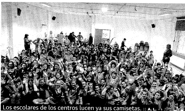
Los escolares de los centros lucen ya sus camisetas. :: A. L.

los años se han convertido en los diez temas que se tratan en la actualidad. Es un servicio itinerante, es decir, el personal municipal se desplaza a todos los centros escolares atendiendo de este modo a todo el alumnado de Educación Primaria que estudia en el municipio. A lo largo de sesiones en las que se combina la teoría y la práctica, así como en los recorridos ecológicos, abordan diferentes temas de carácter ambiental relacionados con Ermua.