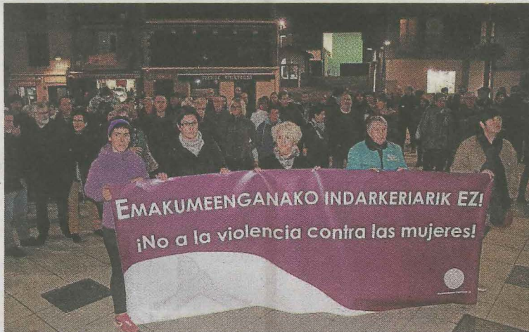
Emakumeen indarkeriaren aurkako elkarretaratzea. SALEGI

«Emakume eta gizonen arteko berdintasuna, denon artean eraiki beharreko gaia da, beraz Udaletik gonbidatu nahi zaituztegu prozesu honetan parte hartzera guztion ekarpenak beharrezkoak eta interesgarriak direlako. Eta elkarrekin lan egiten bakarrik, lortuko dugu etorkizuneko Deba eraikitzea, berdintasu-