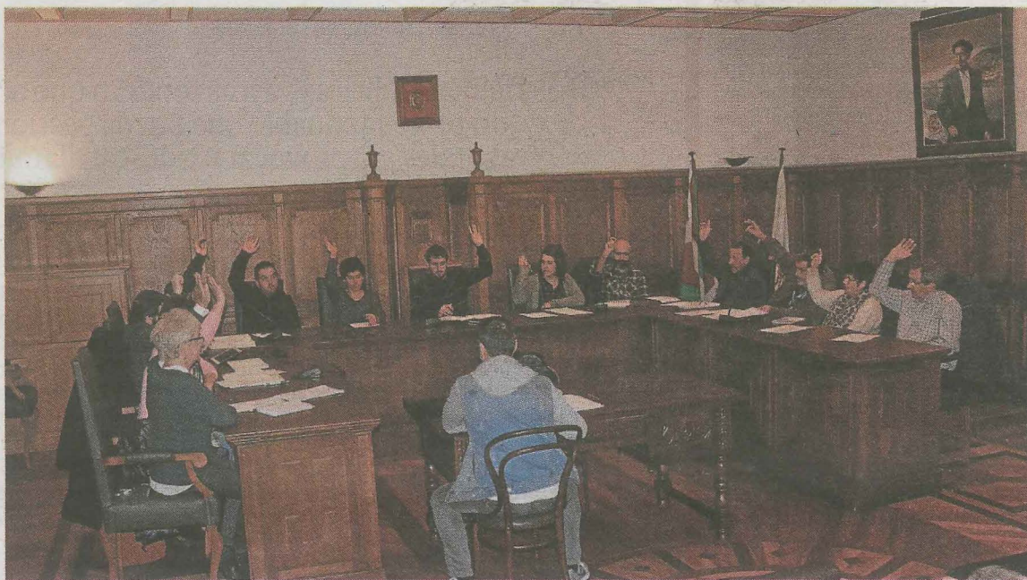
Aho batez onartu ziren Euskera eta Azaroak25eko adierazpenak. ANDER SALEGI

Arlo sozioekonomikoak eta euskararen erabilera elkarri egin behar dioten ekarriaren garrantzia ere nabarmentzen da agirian, «ez da gutariko inorentzat ezezaguna, bai bai-