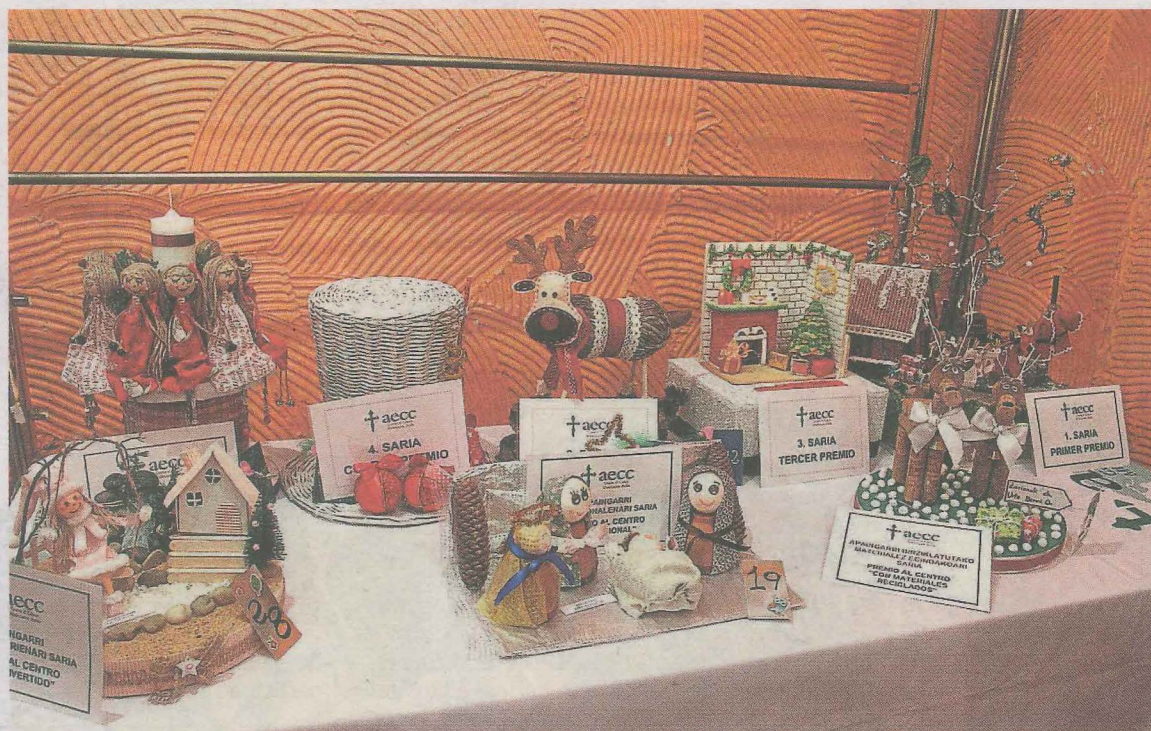
Exposición de los trabajos presentados en la última edición del concurso.

Además de los centros ganadores, los cuales recibirán distintos premios gracias a la gentileza de distintos establecimientos y comercios del municipio de Ermua que colaboran desinteresadamente con esta iniciativa, se sortearán diversos premios entre el resto de los participantes en el concurso.