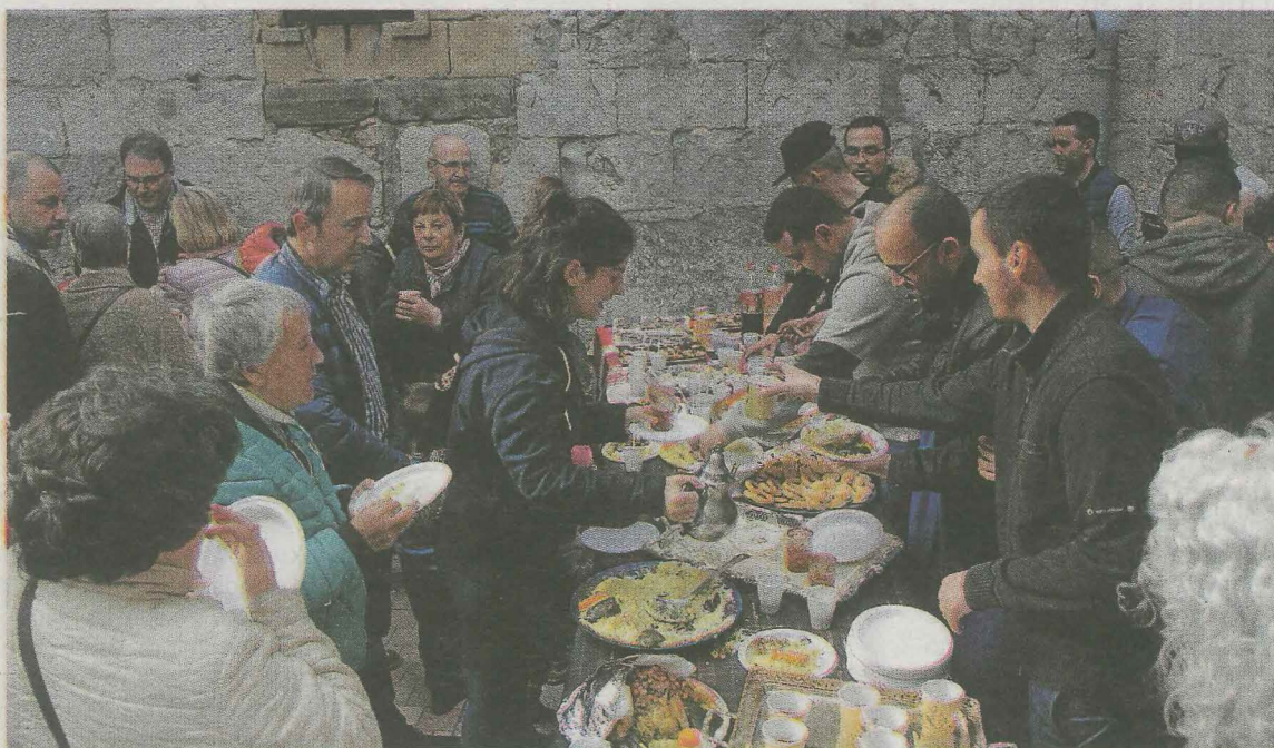
La gastronomía árabe fue la base del lunch que se ofreció tras la inauguración.

El domingo por la tarde comienza el mes del Ramadán. Antes de que