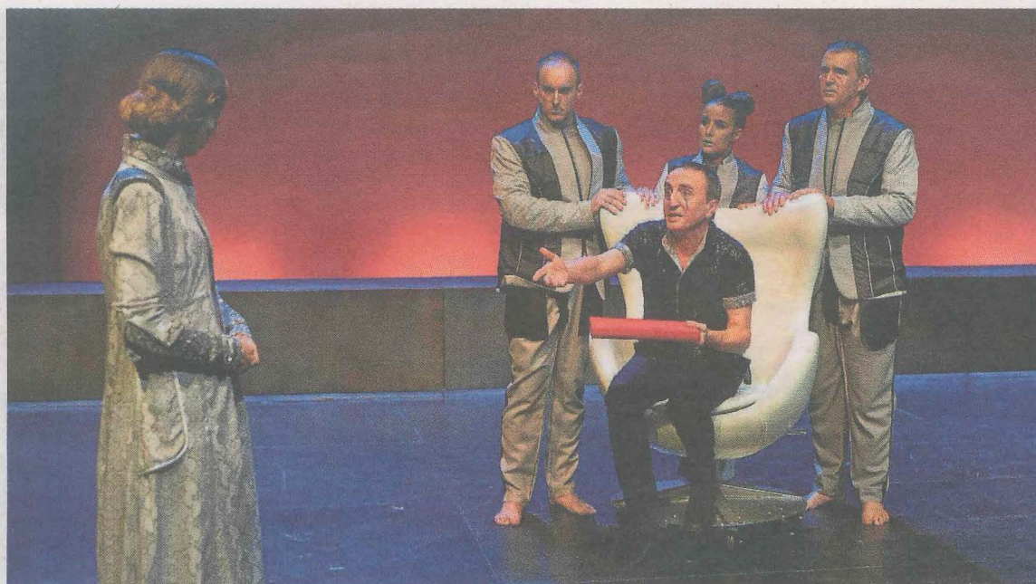
La compañía Tartean durante una representación de su obra 'Ghero'. ■ MARINA GONDRA

■ La Ikastola Anaitasuna celebrará los días 24 y 25 de mayo su 50 aniversario. Los tickets para la comida popular del día 25 y las camisetas de esta celebración se pueden adquirir, hasta el día 10 de mayo en la Ikastola. Además quienes deseen aportar fotografías para la exposición, que se llevará a cabo desde el 20 al 31 de mayo, podrán hacerlo en el correo anaitasuna50@gmail.com.