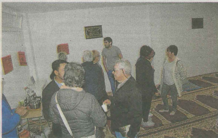
Interior de la mezquita, con carteles en euskera, como se aprecia a la derecha.

amanezca, los musulmanes en el «mes sagrado» hacen la primera oración del día y desayunan copiosamente ingiriendo más calorías de lo normal para poder aguantar hasta el ocaso. Posteriormente, cada uno hace las tareas que habitualmente