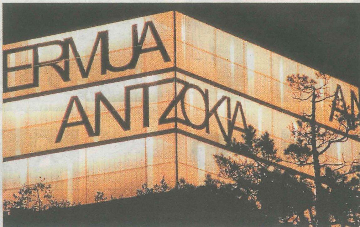
El Ermua Antzokia junto con Lobiano son los recintos culturales neurálgicos de Ermua. AINHOA LASUEN

La intención del Departamento de Cultura del Ayuntamiento es la de que la programación de películas comerciales regrese a las pantallas del Ermua Antzokia en el mes de octubre y será entonces cuando se vuelva a poner