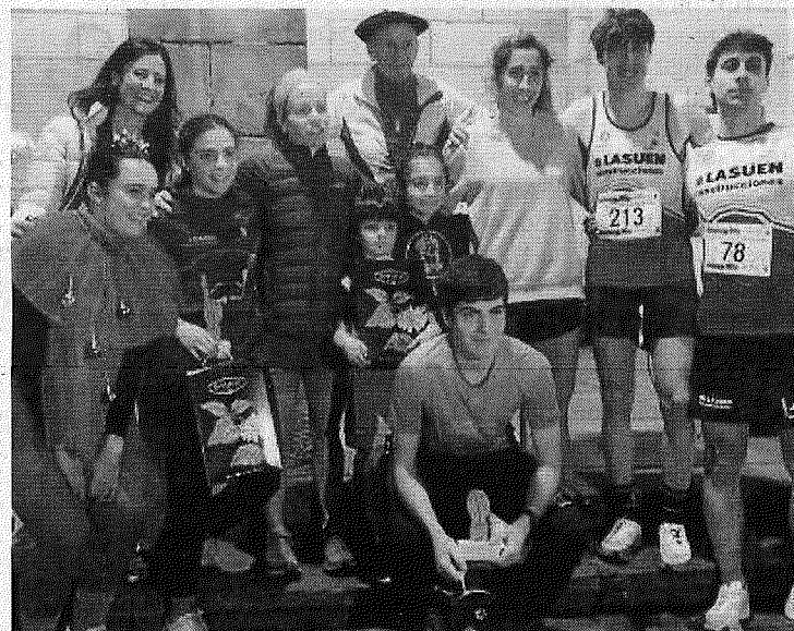
Las pruebas de San Silvestre regresan a Durangaldea. Foto: K. Doyle

De este modo, la comarca de Durangaldea volverá a despedir el año con las pruebas deportivas, manteniendo viva una tradición que combina ejercicio y ambiente festivo. — K. Doyle