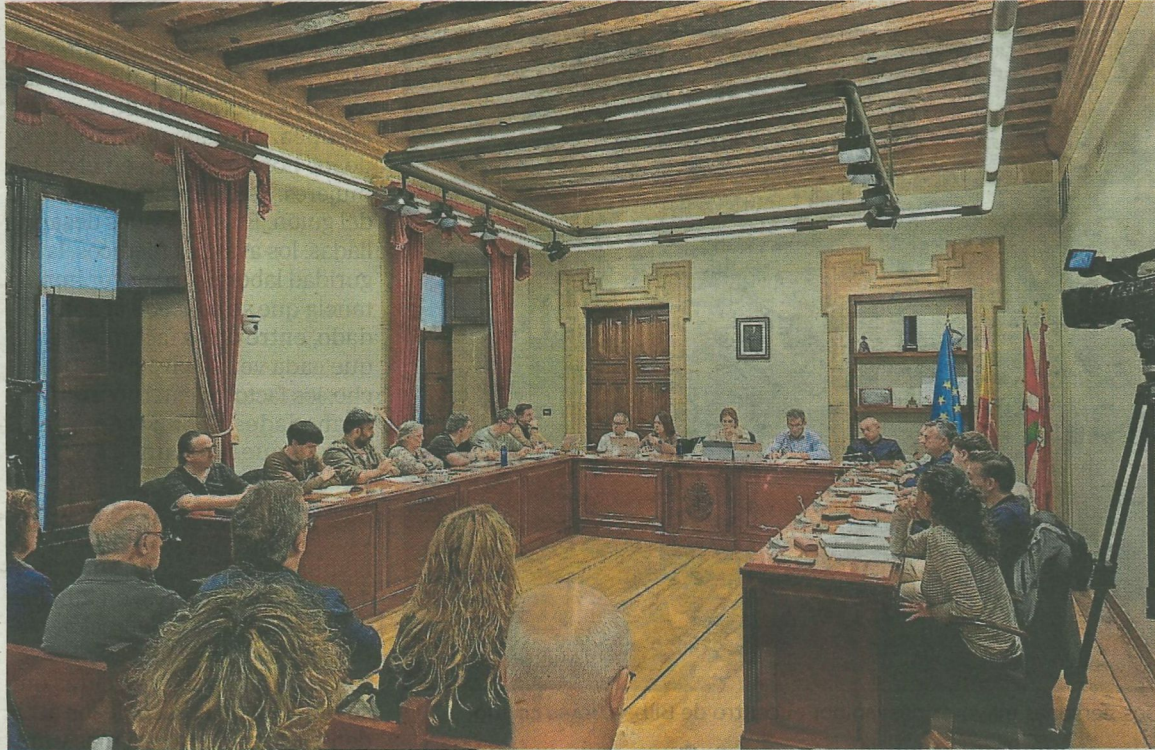
Imagen de archivo de la corporación municipal durante una sesión plenaria anterior. A. L.

Asimismo, destacó que el incremento en la inversión municipal permitirá ejecutar actuaciones clave en eficiencia energética, digitalización y mejora de