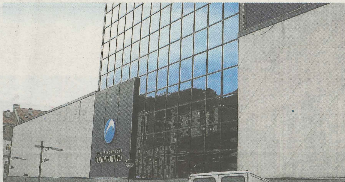
Actualmente, parte de las reservas de espacios se realizan por teléfono o de forma presencial. A.L.