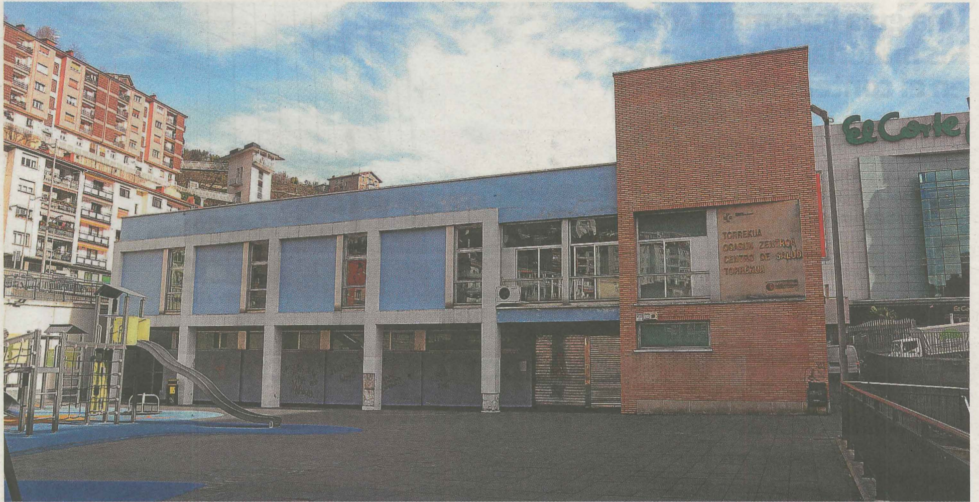
Las dependencias vacías del Centro de Salud de Torrekoa serán utilizadas para que la Cruz Roja preste sus servicios.