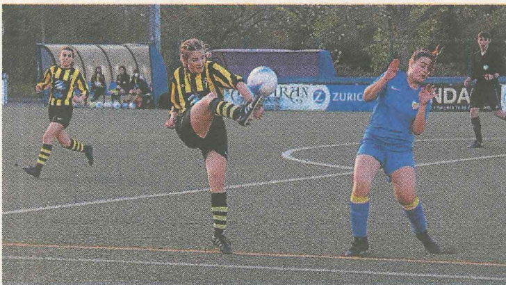
Elaija marcó el primer gol frente al Urola.