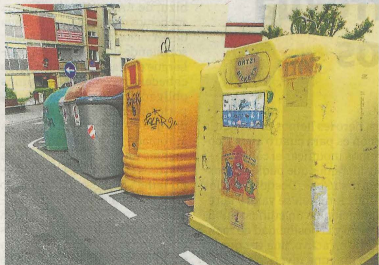
La guía informará sobre los materiales a depositar en el amarillo. A.L.

El objetivo de esta actuación es crear un cambio de percepción de los residuos en la ciudadanía a la hora de reciclar.