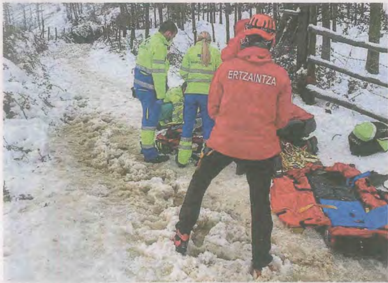
Los sanitarios intentaron sin éxito reanimar al fallecido.