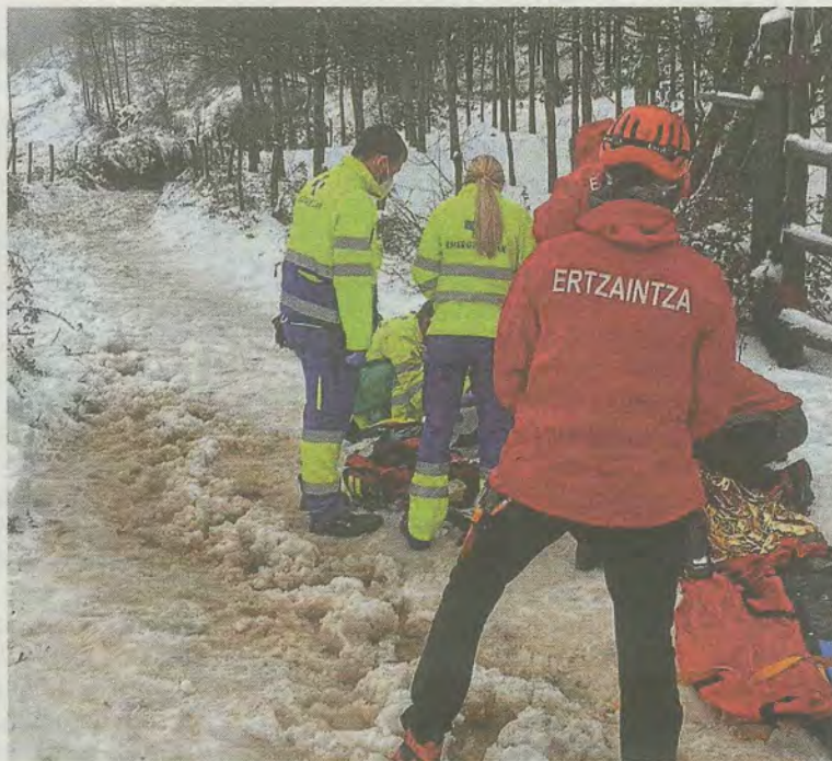
Los servicios de emergencia intentaron reanimarle sin éxito.

Los servicios de emergencia recibieron el aviso de un particular sobre las 10.45 horas de que un montañero se había desvanecido y que se encontraba inconsciente. Hasta el lugar se desplazaron los servicios de emer-