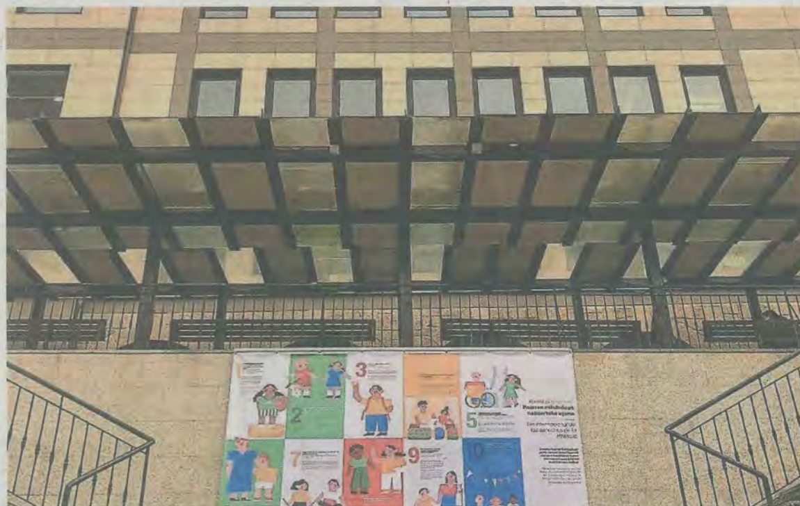
El alcalde defendió la inversión municipal en este servicio, en el Pleno de aprobación de Presupuestos.

tran los clubes de lectura para personas adultas en euskera, castellano, inglés y francés, el club de lectura de cómic, los clubes de lectura juvenil, en papel o digitales, y los grupos de conversación en inglés y francés.