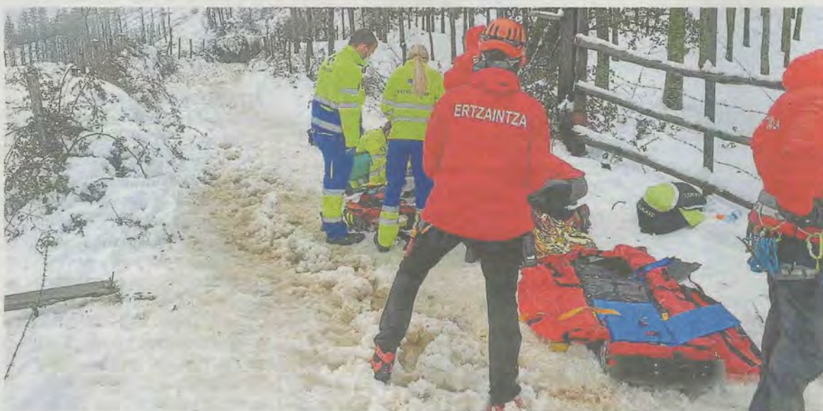
Los servicios de emergencia intentaron reanimar a la víctima.

Fue sobre las 10.45 horas cuando un informante avisó a los servicios de emergencia de que un montañero había sufrido un desvanecimiento en el monte Urko, ubicado entre los municipios de Ermua y Eibar. Hasta el lugar se desplazó la unidad móvil de la Ertzaintza, un helicóptero de la policía autónoma, bomberos y una UVI móvil. Según detalló la Unidad de Vigilancia y Rescate de la Ertzaintza en Twitter, comenzaron ellos mismos