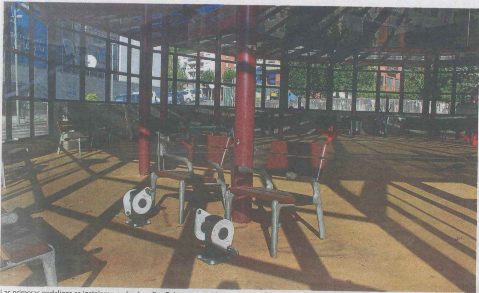
Las primeras pedalinas se instalaron en la plaza San Pelayo, aunque los nuevos instrumentos estarán adaptados y con asiento complementario. A. L.