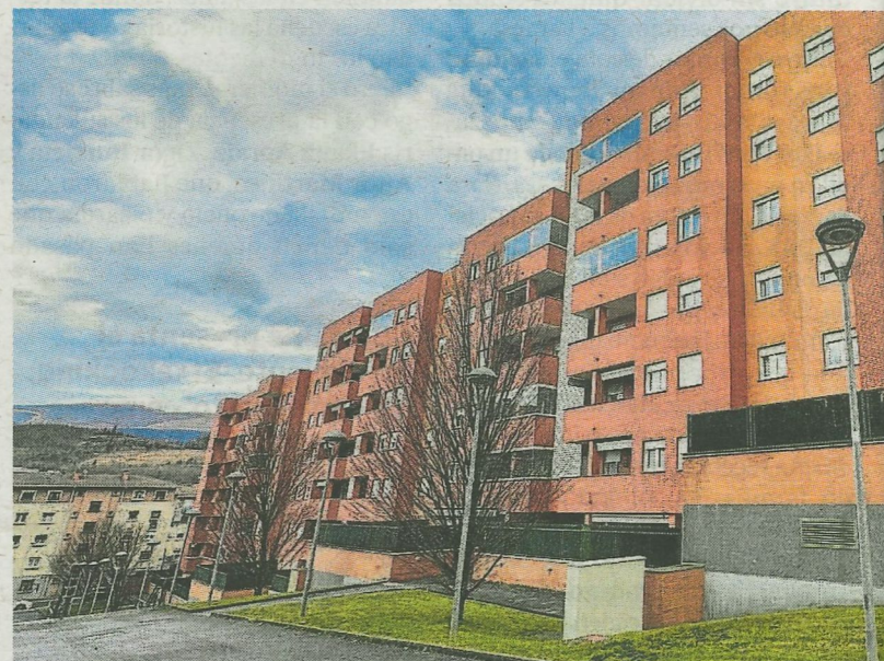
Las viviendas se encuentran ubicadas en el barrio de San Fausto.

Ubicadas en las calles Undatorre número 8 y Jesús María Pedrosa número 7, las viviendas cuentan con uno o dos dormitorios, con superficies que oscilan entre 41 y 63 metros cuadrados y capacidad para entre dos y cuatro personas. Algunas de ellas disponen además de trastero o plaza de aparcamiento vinculada. Todas deberán destinarse a residencia habitual y permanente, siendo obligatorio el empadronamiento en las mismas, y no podrán utilizarse como segunda residencia ni cederse o alquilarse a terceros sin autorización expresa del Ayuntamiento.