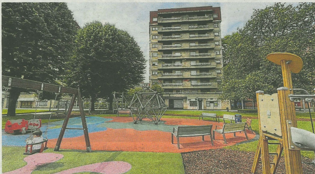
Arrancan las obras del parque San Ignacio.