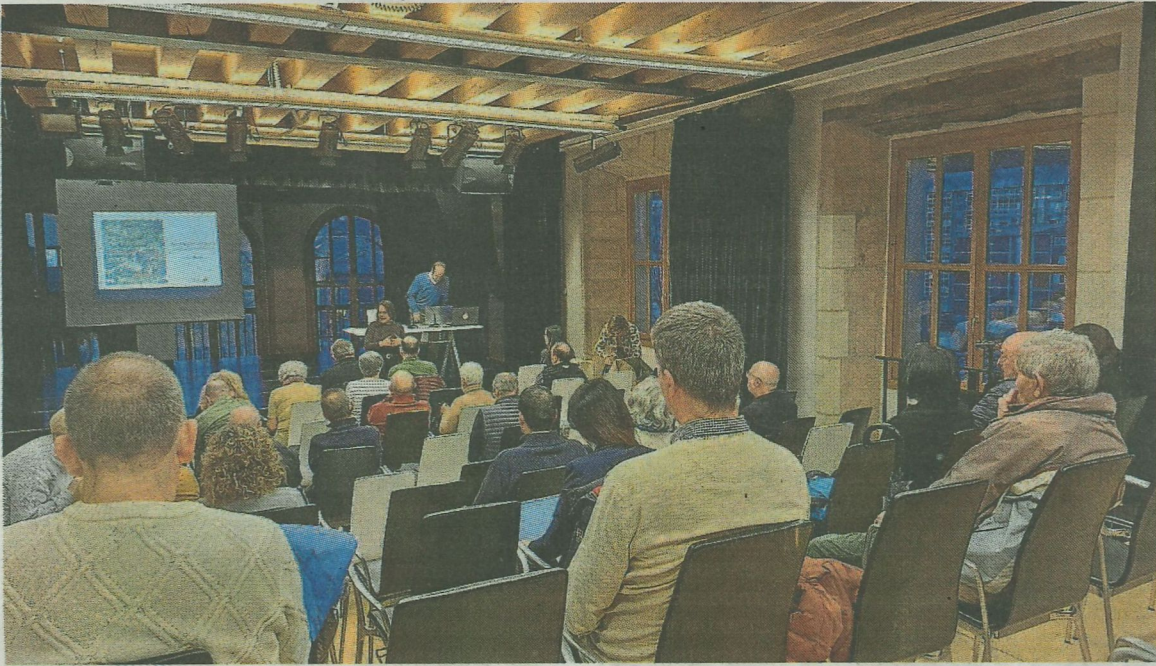
En la reunión se respondieron dudas de la ciudadanía y se ofreció el correo electrónico para aportar ideas. A. L.

La ciudadanía dispone hasta el próximo día 20 de este mes para enviar sus propuestas a través del correo electrónico ekarpenak@udalermua.net . Todas las ideas recibidas serán trasladadas a Tryon, la empresa encargada de la redacción de ambos planes, que posteriormente realizará una valoración estratégica para determinar el equilibrio y la viabilidad de las sugerencias.