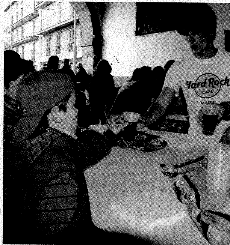
La chocolatada no faltará en la cita de los disfraces. :: SALEGI

La agenda solo tiene una actividad para hoy. Se van a organizar diferentes juegos típicos en dos escenarios. La Plaza de los Fueros y la Plaza Zaharra acogerán esta cita a partir de las 16.30 horas, después de que los pequeños hayan salido de la ikastola. Así, durante la tarde tendrán la ocasión de pasarlo bien con los amigos.