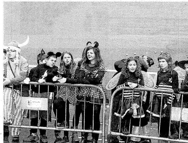
Los disfraces de todo tipo se dieron cita en la plaza. ** A. L.

* EL CORREO no se hace responsable de cambios de última hora