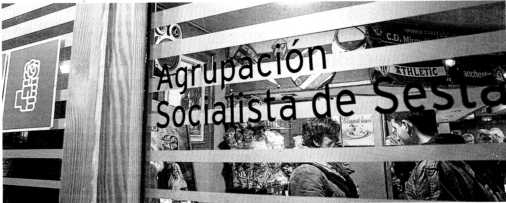
La sede del PSE en Sestao es «un bar más de la calle», según aseguran sus clientes. Dominan los colores del Athletic.