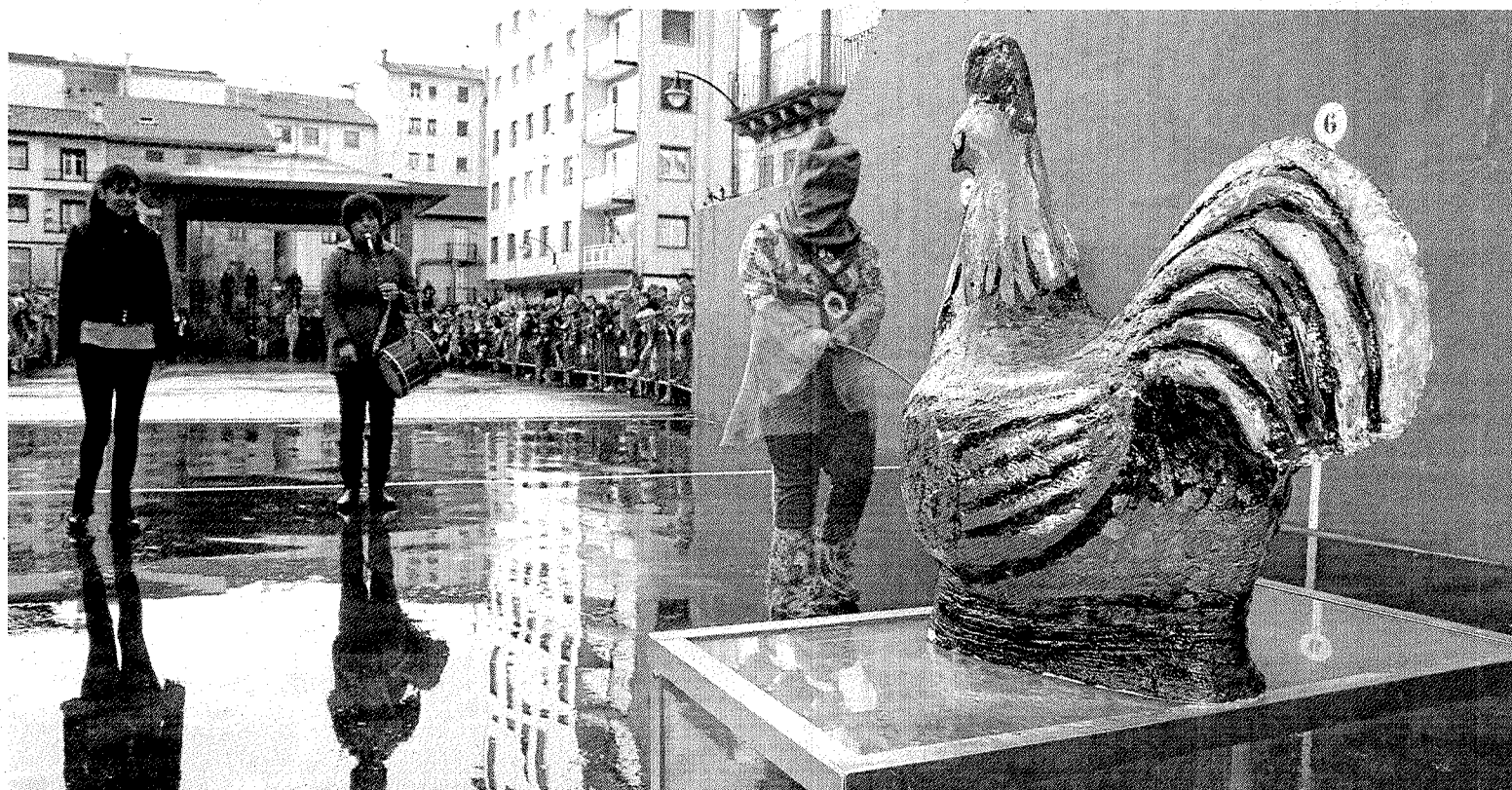
Uno de los participantes en la tradicional prueba hace el intento para quedarse con uno de los gallos. ** A. LASUEN

Después todos los jóvenes se animaron a bailar en la discoteca infantil, en algunos momentos con el paraguas abierto.