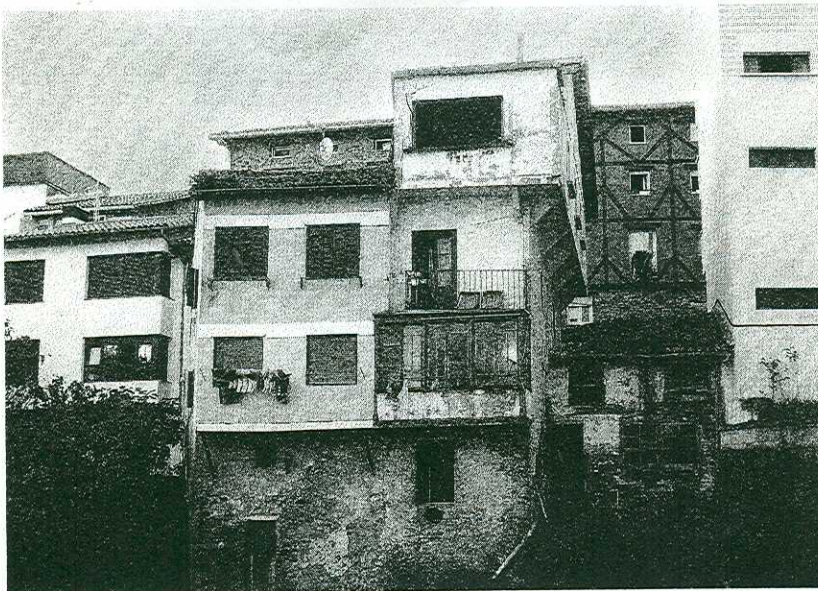
NECESARIO ORDENAMIENTO EN MUTRIKU. La entrega de las nuevas viviendas construidas en la calle San Agustín con su correspondiente plaza habilitada en la planta baja, ha dejado al descubierto lo necesario que sigue siendo la rehabilitación en el municipio o su correspondiente ordenamiento, en el que tanto propietarios como instituciones públicas deberían de hacer algo más para que se llegue a concretar los acuerdos.

Los dos concejales de la plataforma Berdeak+Independienteak han salido a la palestra en relación con el escrito publicado por la Izquierda Abertzale respecto al incremento de las tasas. Citan los