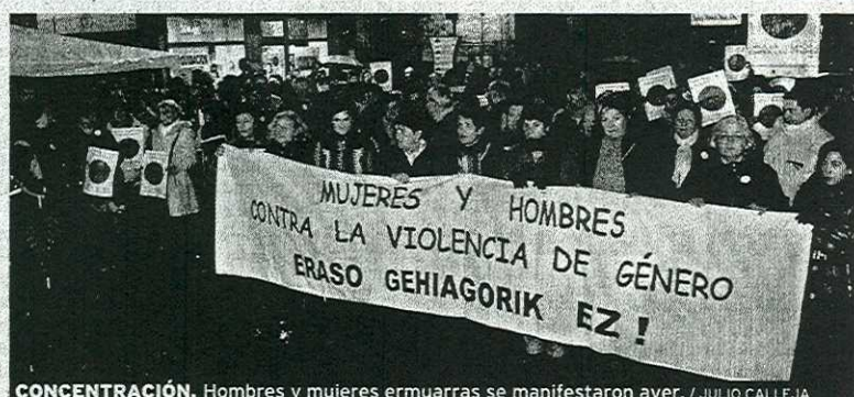
CONCENTRACIÓN. Hombres y mujeres ermuarras se manifestaron ayer.