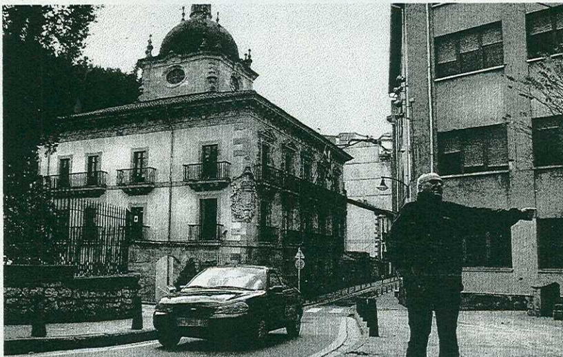
AYUNTAMIENTO. Una vista exterior de la casa consistorial de Ermua

Es decir, que se aplique la subida del 42, % más 1 en sus sala-