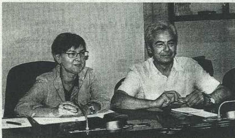
La consejera y el alcalde de Ermua en su comparecencia de ayer.