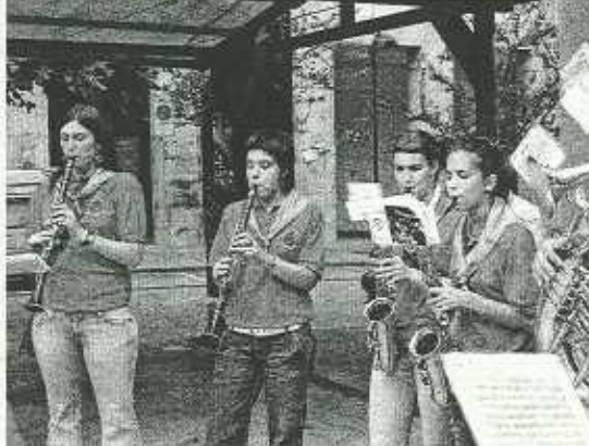
La txaranga Bizi Poza no faltará a su cita con las fiestas.

Hoy a partir de las 19.00 horas, en el salón de Plenos del Ayuntamiento se va a celebrar una reunión, en la que se abordará el tema de las termitas. ■