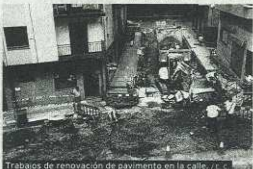
Trabajos de renovación de pavimento en la calle. / C. C.