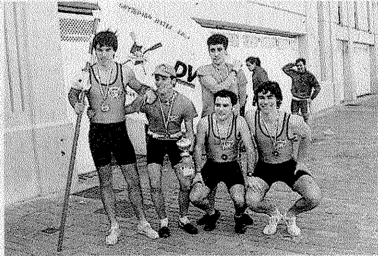
Los remeros locales, que bogarán en las tostas de Zumaia B.

La prueba constará de cuatro tandas, la primera por parejas, usando dos calles y con una distancia de un minuto entre embarcaciones, así los primeros en bogar serán Getaria e Hibaika, al minuto Ondarroa y Zumaia B, posteriormente Elantxobe e Ilunbe, les seguirán Zierbena y Arkote y concluirán Santurtzi y Donostia. Tras esta bonita prueba llegarán el turno de las a priori embarcaciones más fuertes, así en la segunda tanda y usando tres calles bogarán Za-