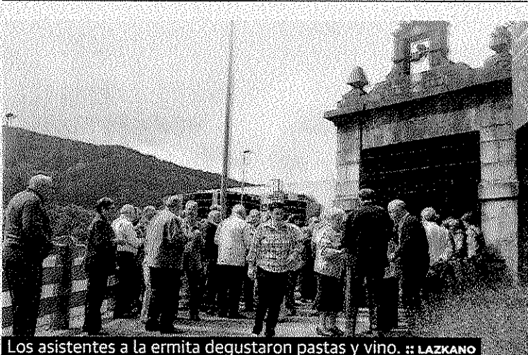
Los asistentes a la ermita degustaron pastas y vino.