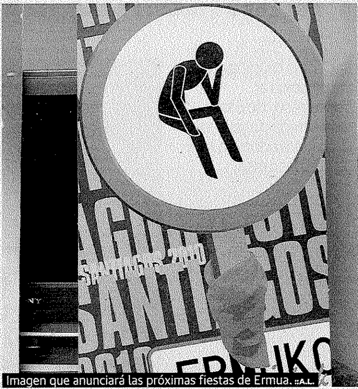
Imagen que anunciará las próximas fiestas de Ermua. #A.L.