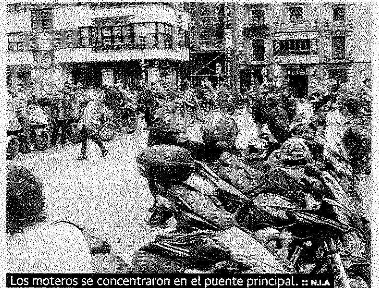
Los moteros se concentraron en el puente principal. :: N.I.A.