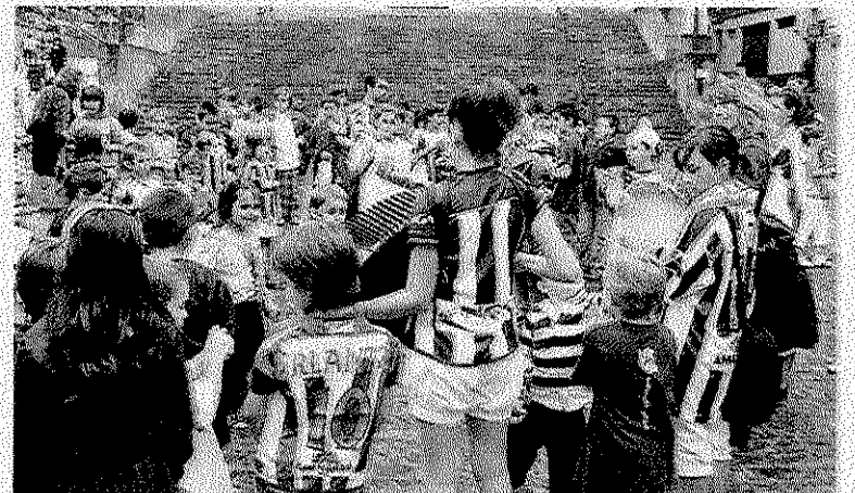
Celebración. Los mutrikuarras se tiraron a la calle para celebrar el ascenso de la Real Sociedad.

días antes en las mismas aguas. Zumaia B, en la que bogan cinco remeros locales, se defendieron a la perfección situándose en el puesto diecisiete y el premio al mejor patrón se llevó una vez más Zuriñaga de Kaiku. Hubo trofeos para las embarcaciones participantes y para el patrón y la única pega fueron las sanciones que se impusieron a los automóviles mal aparcados.