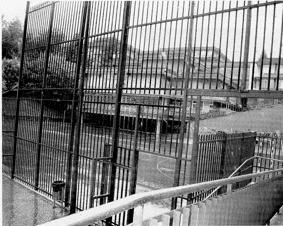
El patio de patio de Ongarai Eskola donde se celebrará la 'sokamuturra'.

Esta modificación se produce debido a que este año la Peña Taurina local Rui Bento Vasquez no organizará los festejos taurinos que solía celebrar (novilladas o corridas el día 25