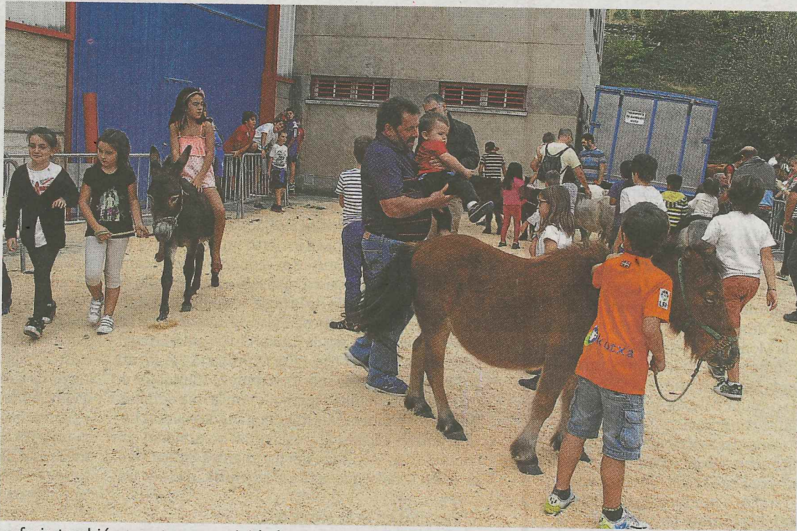
La feria también cuenta con actividades para que los niños disfruten de la jornada.

La Feria de Itziar contará también con la presencia de Gorriti, quien acudirà acompañado de sus animales. Por otro lado, los aizkolaris Hodei Ezpeleta y Zelai III realizarán una exhibición. El programa se tomara un descanso a las 15.00 horas, momento en el que se dará por concluida esta actividad. No obstante, a las 18.30 horas, tendrá su continuación en la plaza de Itziar con un desafío. Los miembros del equipo de giza proba de Itziar se enfrentarán a los remeros de Zumaia en una prueba de giza proba.