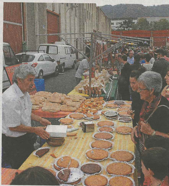
El ganado y la gastronomía son elementos protagonistas de la Feria de Itziar.