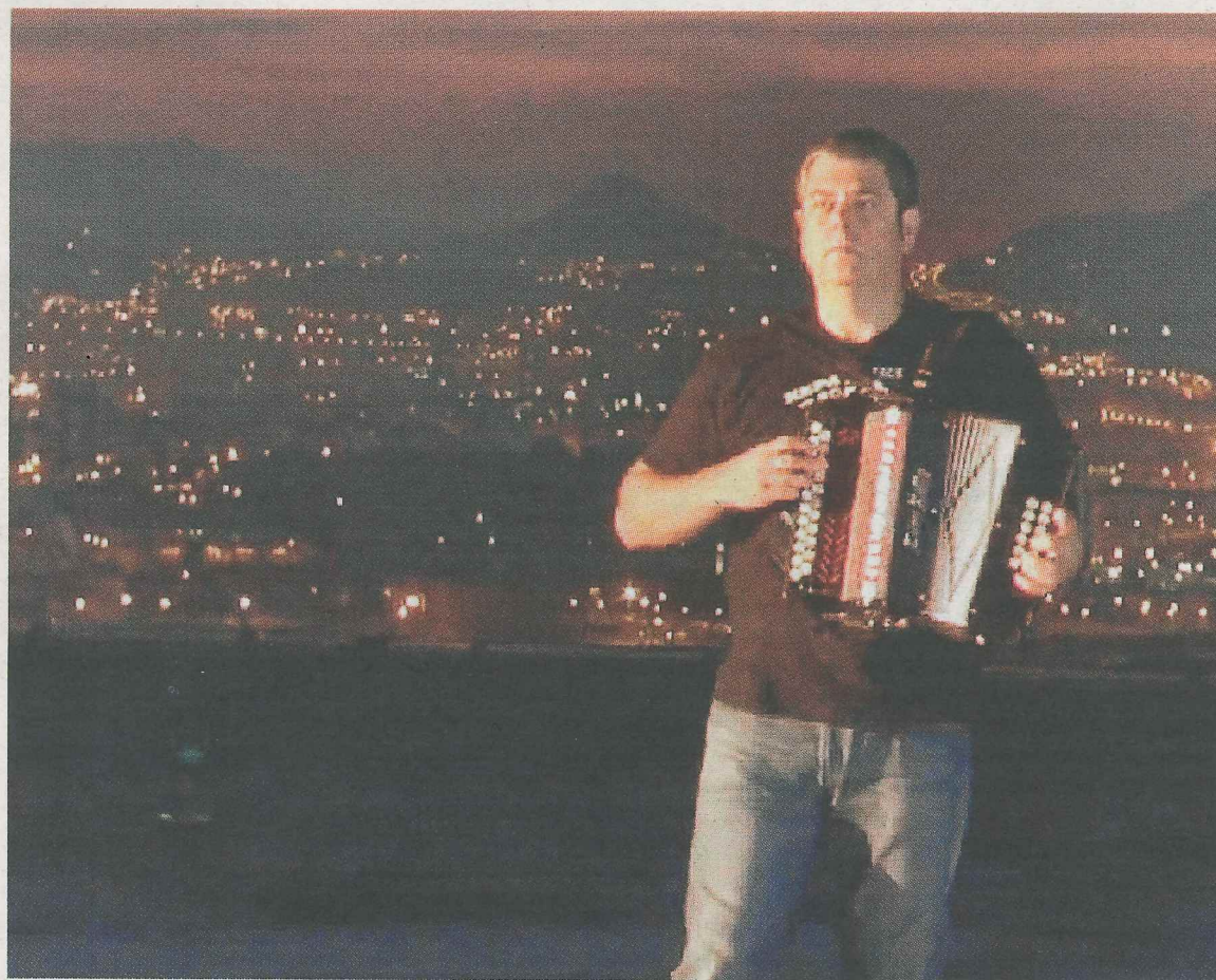
La música de Kepa Junkera estará presente en el espectáculo 'Txapeldun' en Antzokia. ■ EL CORREO

El Ayuntamiento de Ermua también colaborará con el 'San martin kulturala' con la organización del espectáculo de música, danza y teatro 'Txapeldun', que se ofrecerá el día 6, a partir de las 22.15 horas en el Antzokia. Este espectáculo mostrará las múltiples vivencias de un campeón. El reconocido acordeonista Kepa Junkera aporta con su música esa parte de las raíces vascas a partir de las cuales se trabaja en 'Txapeldun', las voces y la percusión de 'Sorginak' acompañan magistralmente esta música y la interpretación y la danza de Eneko Balardi completan el conjunto.