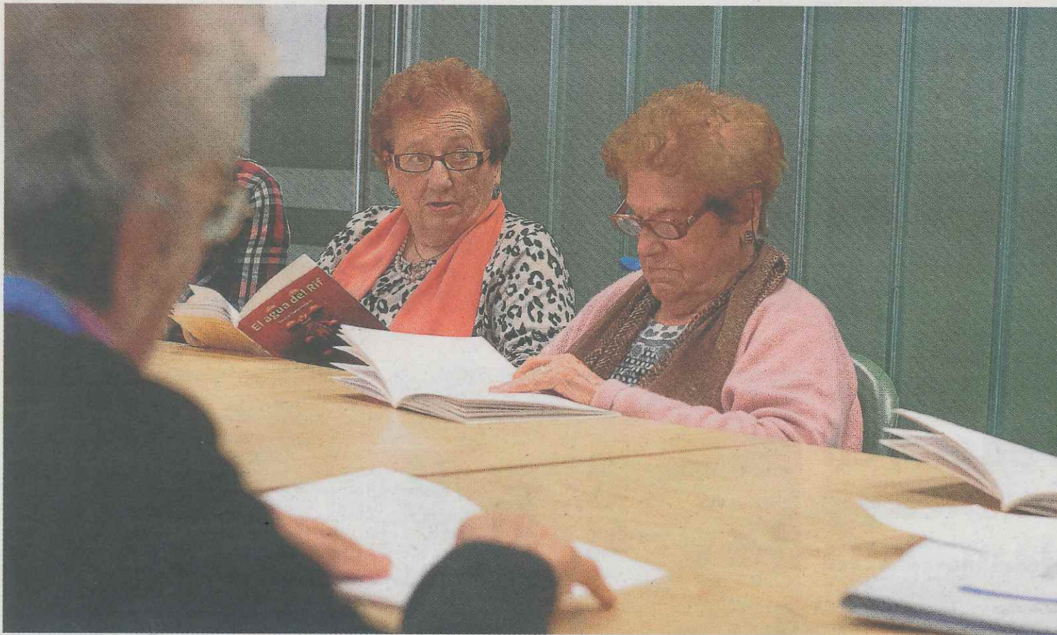
Dos de las participantes en la sesión celebrada la semana pasada con el libro 'El agua del Rif'.