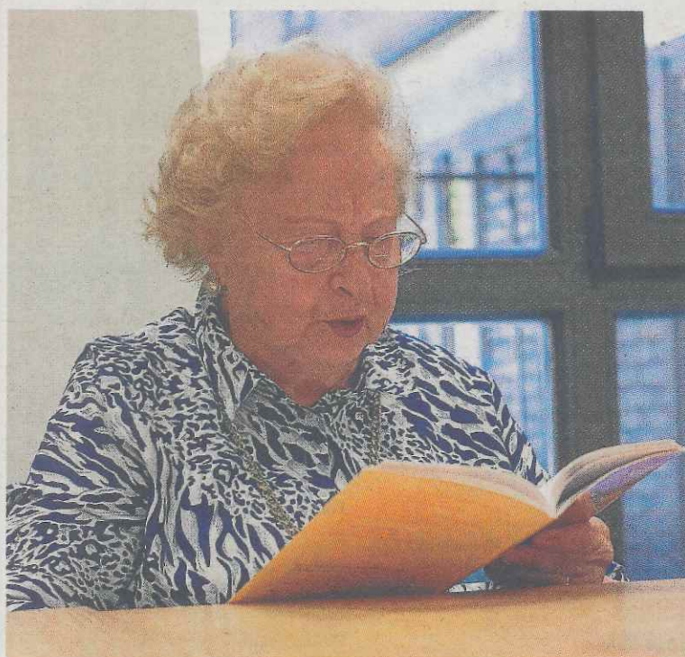
Cada una de las participantes lee una parte en voz alta.

A unas edades en las que la estimulación cognitiva se hace necesaria la lectura se presenta como un ejercicio saludable. Además, un grupo diverso hace que los temas que surgen en los libros salgan a debate y se promueva el respeto entre ellas.