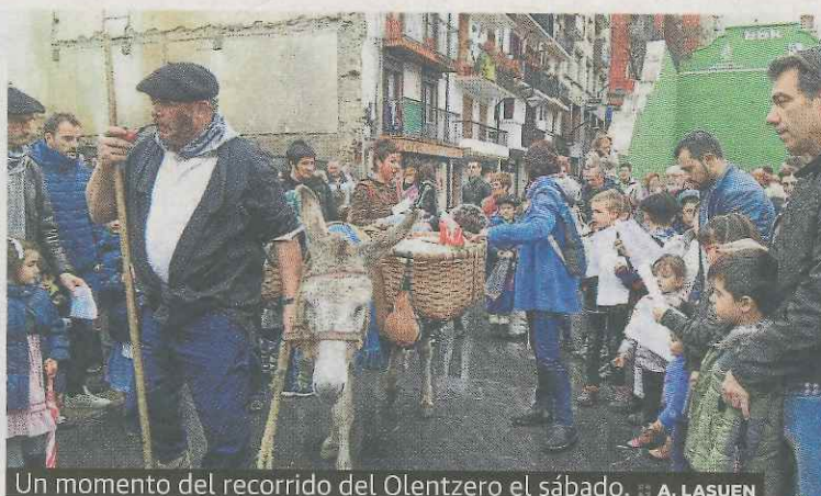
Un momento del recorrido del Olentzero el sábado.

taron con sus familias y otros disfrutaron con los caramelos que repartía el popular carbonero durante toda la kalejira. El buen ambiente estaba garantizado, ya que los tritilaris de la Escuela de Música Alboka acompañaron el pasacalles en el que se cantaron numerosos villancicos, aunque el más repetido lógicamente fue el destinado a Olentzero, que con todo el cariño atendió a todos los presentes sacándose fotos y dando un beso a todo el que se lo pedía.