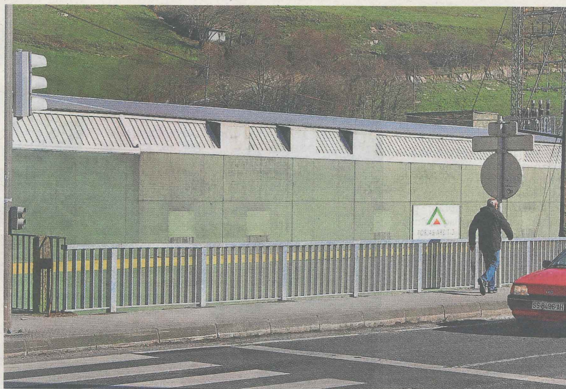
Zona, junto a Forjas Areitio, en la que se trata de aclarar los límites entre Ermua y Zaldibar.

Hay que tener en cuenta que el trazado de la línea recta por parte de los técnicos de la Diputación foral provocó que una parcela del terreno donde se instala la empresa Forjas Areitio perteneciera al término municipal ermua y otra parte a Zaldibar, dividiendo al mismo tiempo la pertenencia de la empresa a dos municipios.