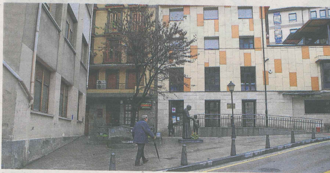
Para solicitar las ayudas que acudir a la sede de Servicios Sociales.

Para solicitar dicha ayuda y tramitar la solicitud, primero será necesario pedir cita previa en Servicios Sociales municipales. Posteriormente todas las solicitudes se deberán presentar en la Oficina de Atención a la