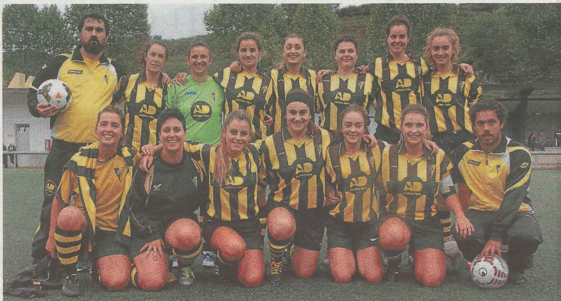
Plantilla del regional femenino, que hoy jugará un emocionante derbi contra el Mutriku.