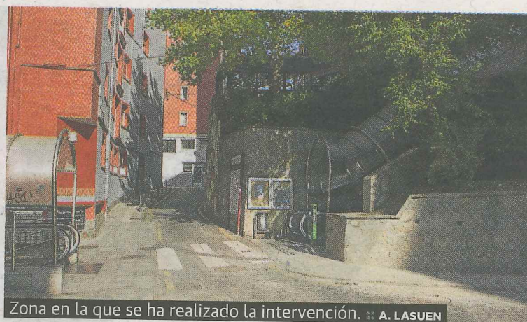
Zona en la que se ha realizado la intervención.

yoría niños y niñas. Se ha recortado el muro entre la primera rampa mecánica y la segunda escalera mecánica de subida a Santa Ana para mejorar la visibilidad en este punto. Anteriormente se impedía una visibilidad adecuada tanto a los peatones como a los vehículos que circulaban por la zona, teniendo en cuenta que se trata de un paso de población infantil al centro educativo de Santa Ana. Estas mejoras son en parte consecuencia de la iniciativa de camino escolar que desarrolla Eskolabbarri desde 2010.