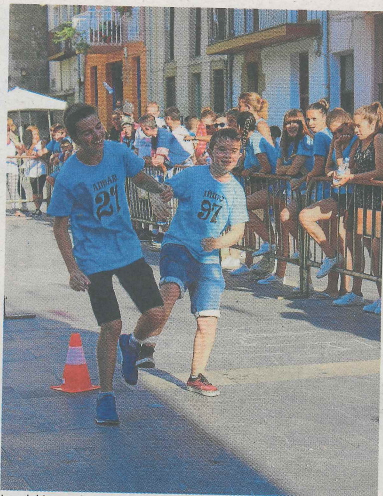
Los del juego de triatlón se lo pasaron en grande... A. L.

Únicamente faltará por desarrollarse el juego del play-back, que suele ser la prueba con más éxito de público y que se celebrará el viernes, en la plaza (22.30 horas).