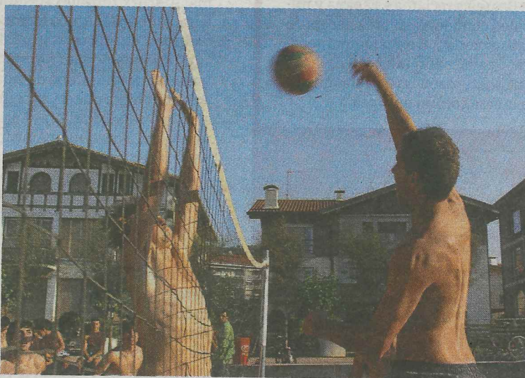
Los partidos fueron casi todos muy disputados.