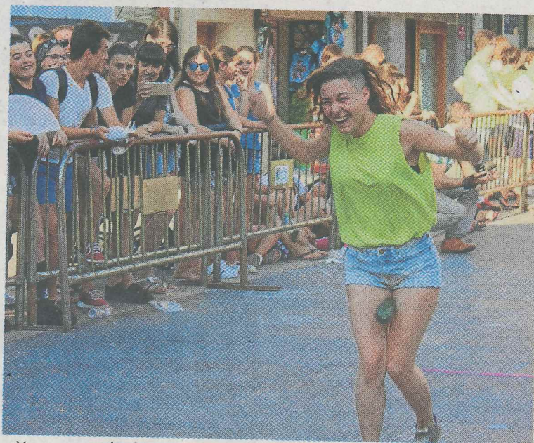
...Y no se puede decir menos del juego del pepino... A. L.