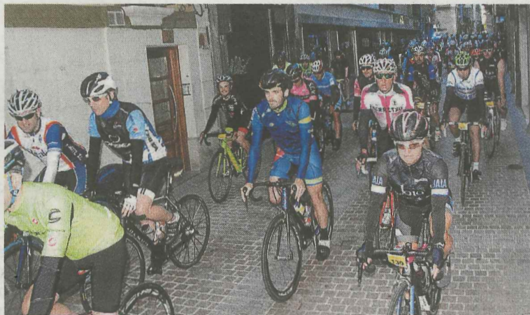
Salida de la XXV Vuelta Cicloturista.

La Vuelta Cicloturista se celebró sin ningún accidente grave. Hubo un traslado al Hospital de Zumarraga a causa de un golpe en la zona de las costillas, pero sin revestir gravedad. A pesar de que no es una competición, la prueba terminó en grupos con diferentes tiempos. El primer grupo de corredores la completó en tres horas y treinta minutos. Al finalizar la prueba cada participante recibió una mochila con el logo de la localidad y una luz para utilizarla