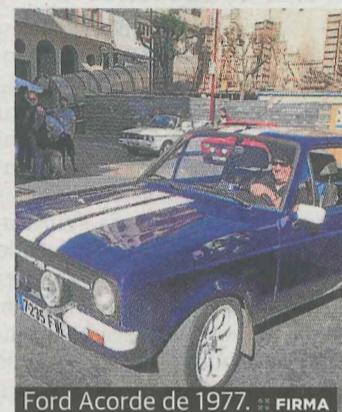
Ford Acorde de 1977.