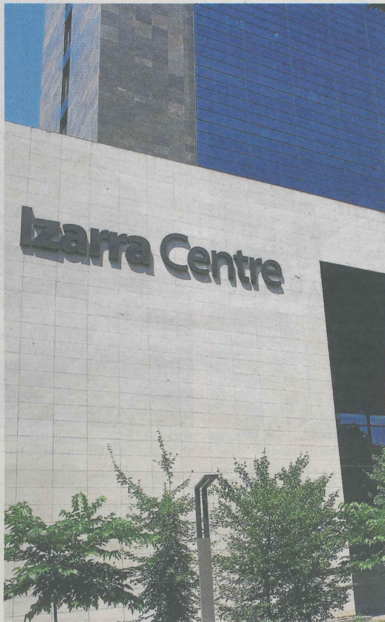
El edificio de Izarra abrió sus puertas en 2013. ■ A.L.

Estos datos se recogen en un informe municipal que apunta que el objetivo del Ayuntamiento de Ermua «para años venideros es seguir dando a conocer la infraestructura para conseguir llegar al 100% de ocupación, consiguiendo con ello atraer nuevos proyectos innovadores que permitan la creación de puestos de trabajo innovadores, así como facilitar unas infraestructuras para que las personas emprendedoras que quieran desarrollar un proyecto de futuro puedan hacerlo con la con-