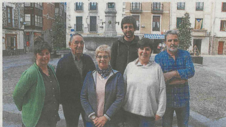
Representantes de los tres partidos políticos de Deba. A.SALEGI

DEBA. Udaleko hiru alderdiak batu ziren maiatzaren 7an herrian egingo den galdeketa bultzatu eta babesteko erabakitako adierazpenak transmititzeko. Lehenengoa, «Debako EH Bildu, EAJ eta Debarren Ahotso alderdiok, Euskal Herriko herritarrei etorkizunaz erabakitzeke, kontsultatuak izateko eta libre eta demokratikoki adierazten duten borondatea errespetatua izateko dagoen eskubidea eta gaitasuna babesten dugula aldarrikatzen dugu». Bigarrena, «demokrazia herritarren erabakia dela, eta, beraz, erabakitzeke eskubidea gauzatzea demokraziaren agerpen gorena dela aldarrikatzen dugu. Horrexegatik, erabakitzeke eskubidearen aldarrikapenetik gauzatzera igarotzeko ekimenak balore jarri eta babestu