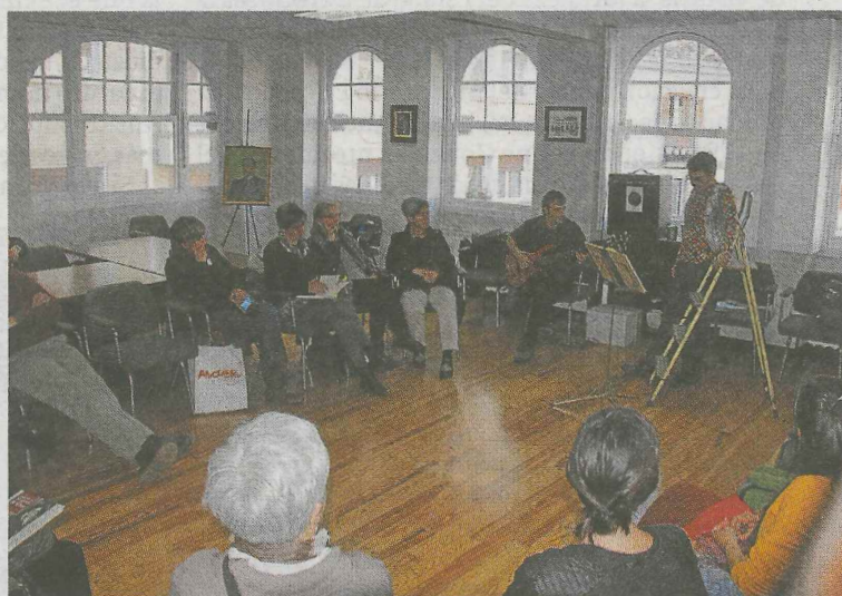
Tertulia literaria en Kultur Elkartea.