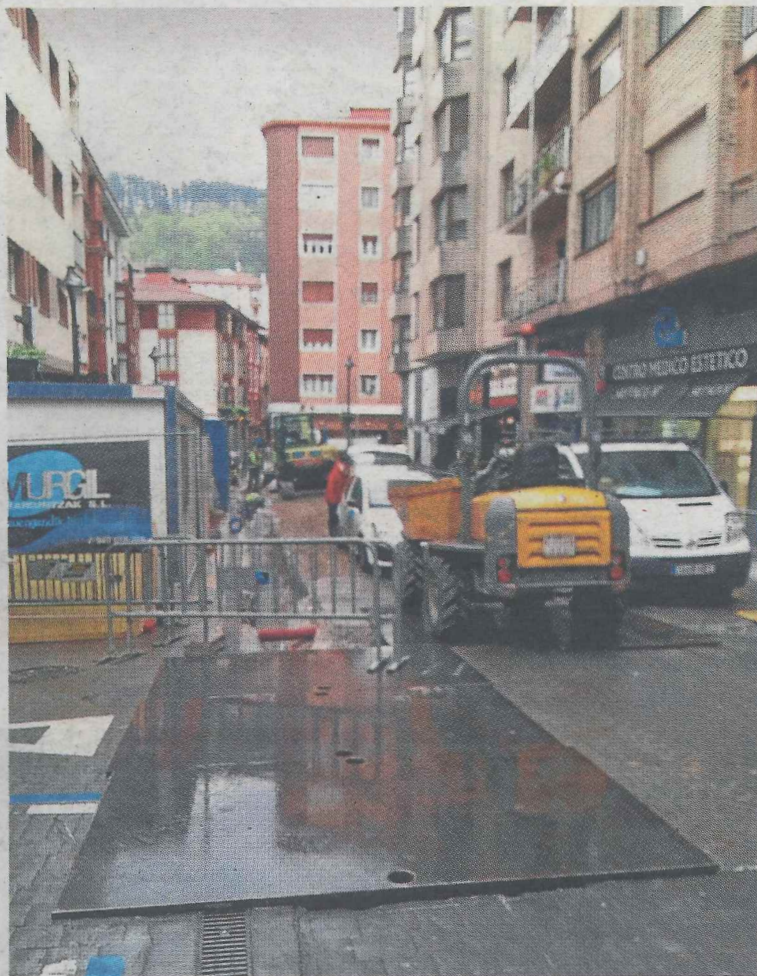
Las obras se prolongarán durante varias semanas.

mentalmente en terreno de tránsito de tráfico rodado.