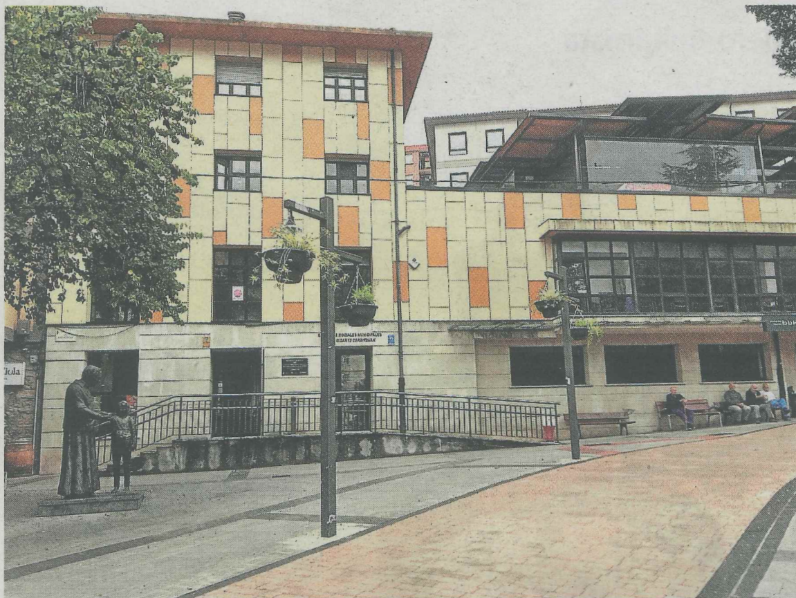
Vista del edificio que acoge las dependencias de Servicios Sociales de Ermua.

También se ofrecerá a estas personas la posibilidad de utilizar la casa del jardinero de Marqués de Valdespina, que se adapta estos días a su nuevo uso, con lavadora, secadora y ducha, para poder asearse en su tránsito por el municipio.