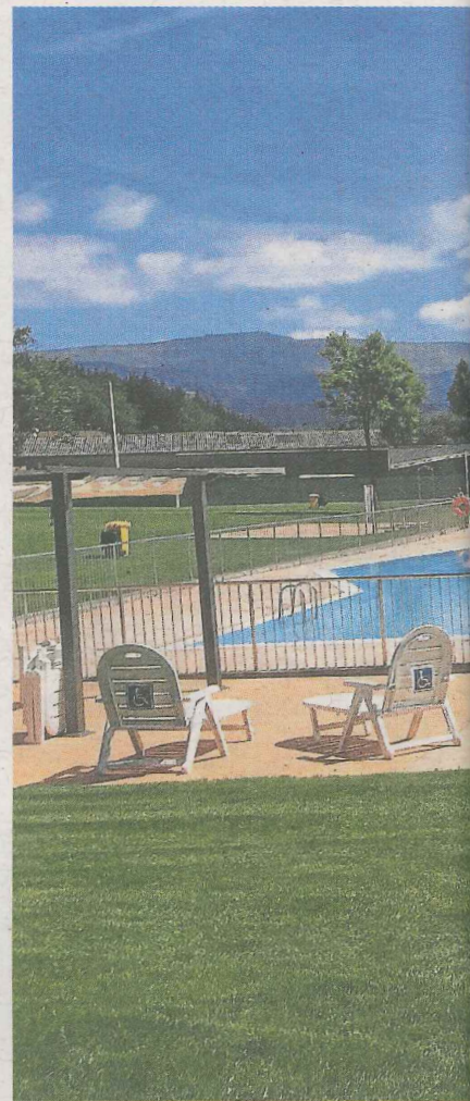
Las renovadas piscinas de Tabira per

y la facilidad de circulación de los usuarios.