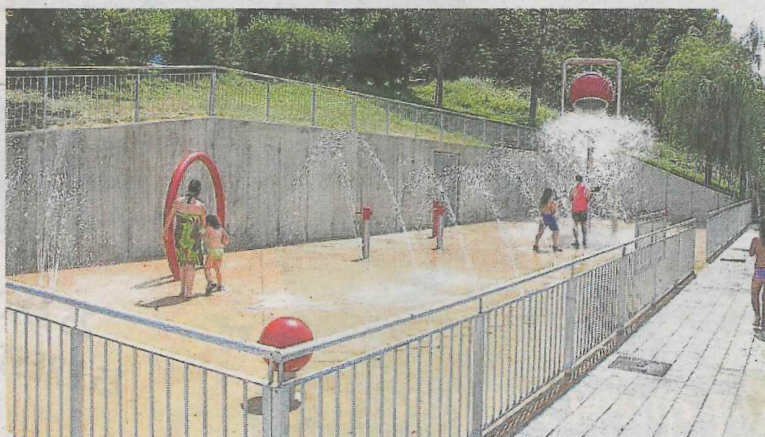
La diversión está asegurada en los juegos de agua de Ongarai.

verano de 2015, la zona de unos 300 metros cuadrados acoge distintos elementos de juego con agua (cañones, chorros verticales, chorros dirigibles, un aro de agua pulverizada y un elemento giratorio que acumula el líquido elemento y después con la oscilación lo vierte en dos tiempos). “La instalación acuática mantendrá este horario continuo hasta el próximo 10 de septiembre”, explicaron fuentes municipales.