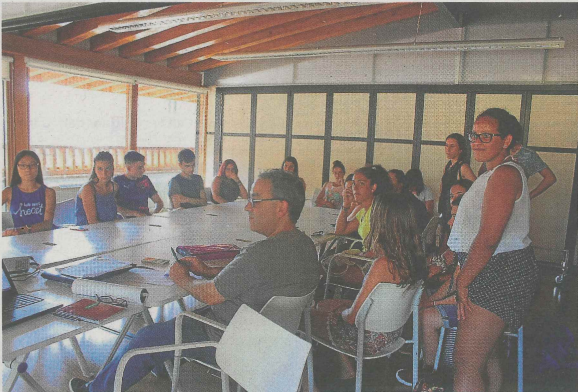
Reunión de la comisión de txarangas de Ermua celebrada la pasada semana.

El concurso de canciones, que se celebrará el día 18, a las 22.30 horas, estará precedido de la popular y exitosa bocadillada, que se iniciará a las