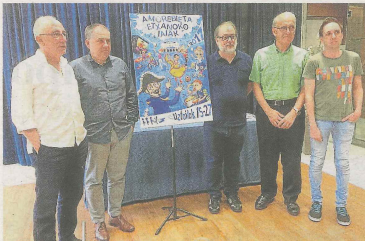
Presentación del cartel de fiestas de este año.