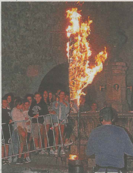
La víspera de San Pedro se celebró con bailes y la tradicional quema de pellejos.