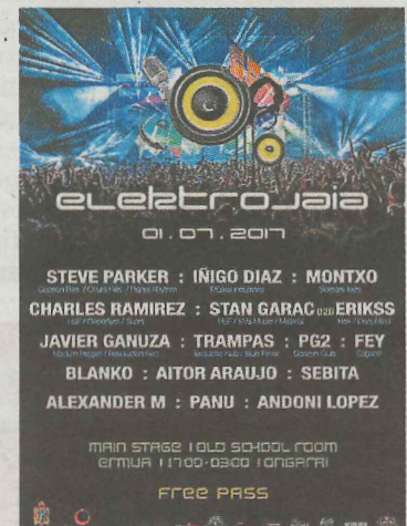
Cartel anunciador. :: K.I.

La entrada será gratuita, y la zona del festival contará con txos-