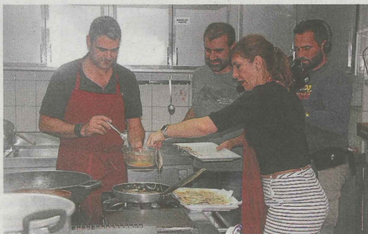
Los reporteros de 'Comando Actualidad' grabaron en La Lubina.