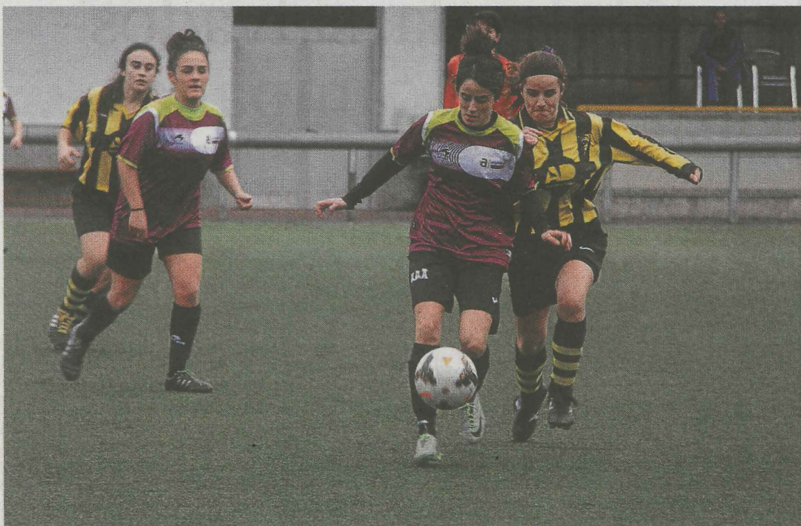
Las chicas del Regional tienen un partido complicado ante el líder, el Orioko.