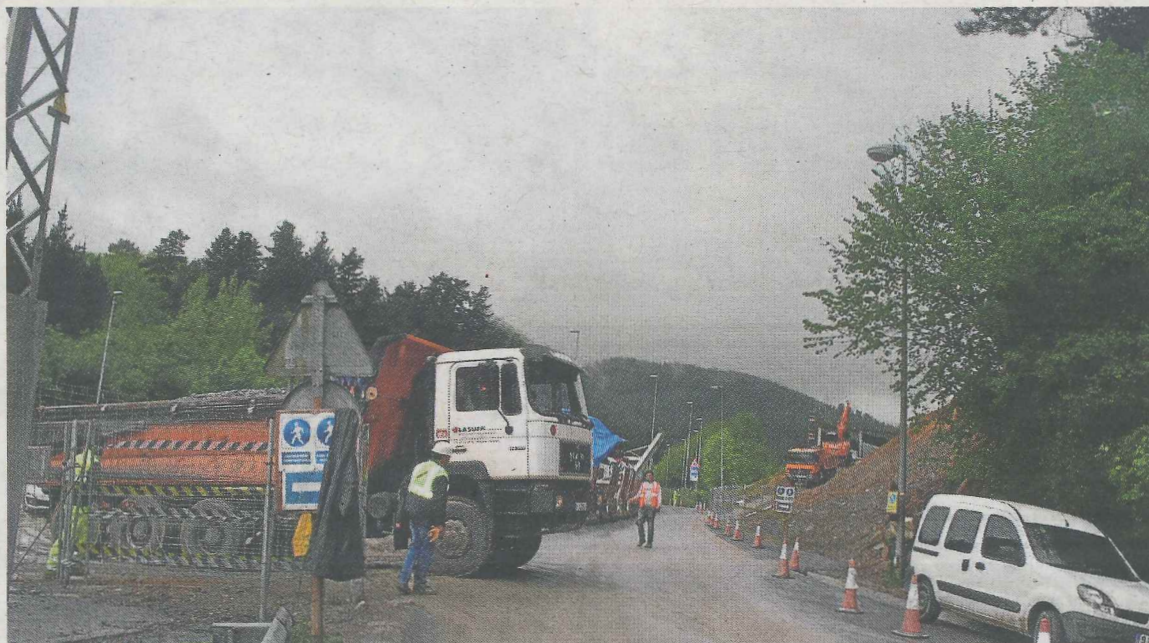
Movimiento de camiones en el barrio de Eizaga a causa de las obras de la variante.

Su pasión es la danza y sueña con convertirse en una bailarina profesional, y para conseguirlo se escapa con la ayuda de su amigo Víctor y viaja hasta el París de 1879.